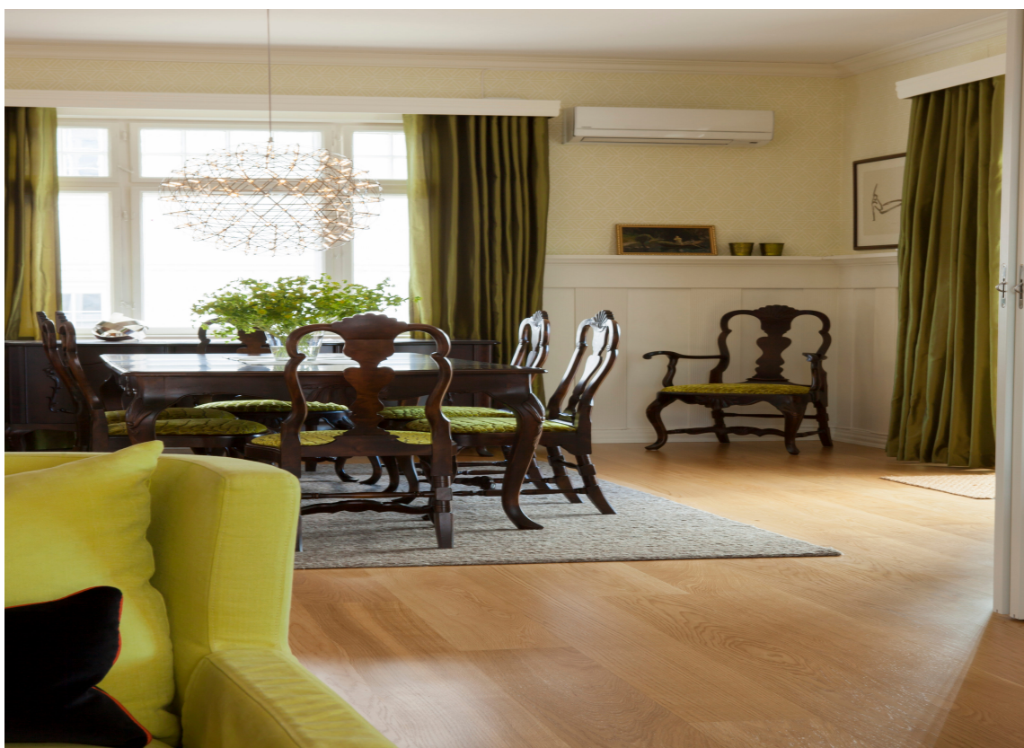
Lær deg å mikse nytt og gammelt. Et eksempel fra boken der en klassisk, lys spisestue i eik er beiset mørk og har fått mørk grønt møbeltrekk. Hovedfargen i rommet er grønt i ulike nyanser. Prikken over i-en er den moderne lampen over bordet.