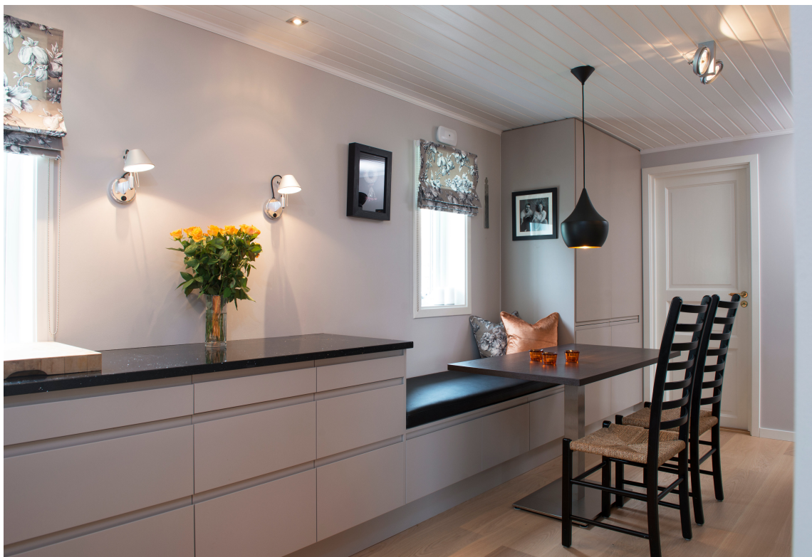
Belysning er mer enn lamper – også på et kjøkken. En godt gjennomtenkt plan for ulike rom og soner tar hensyn til alle behov; arbeidslys og hyggelig stemning.