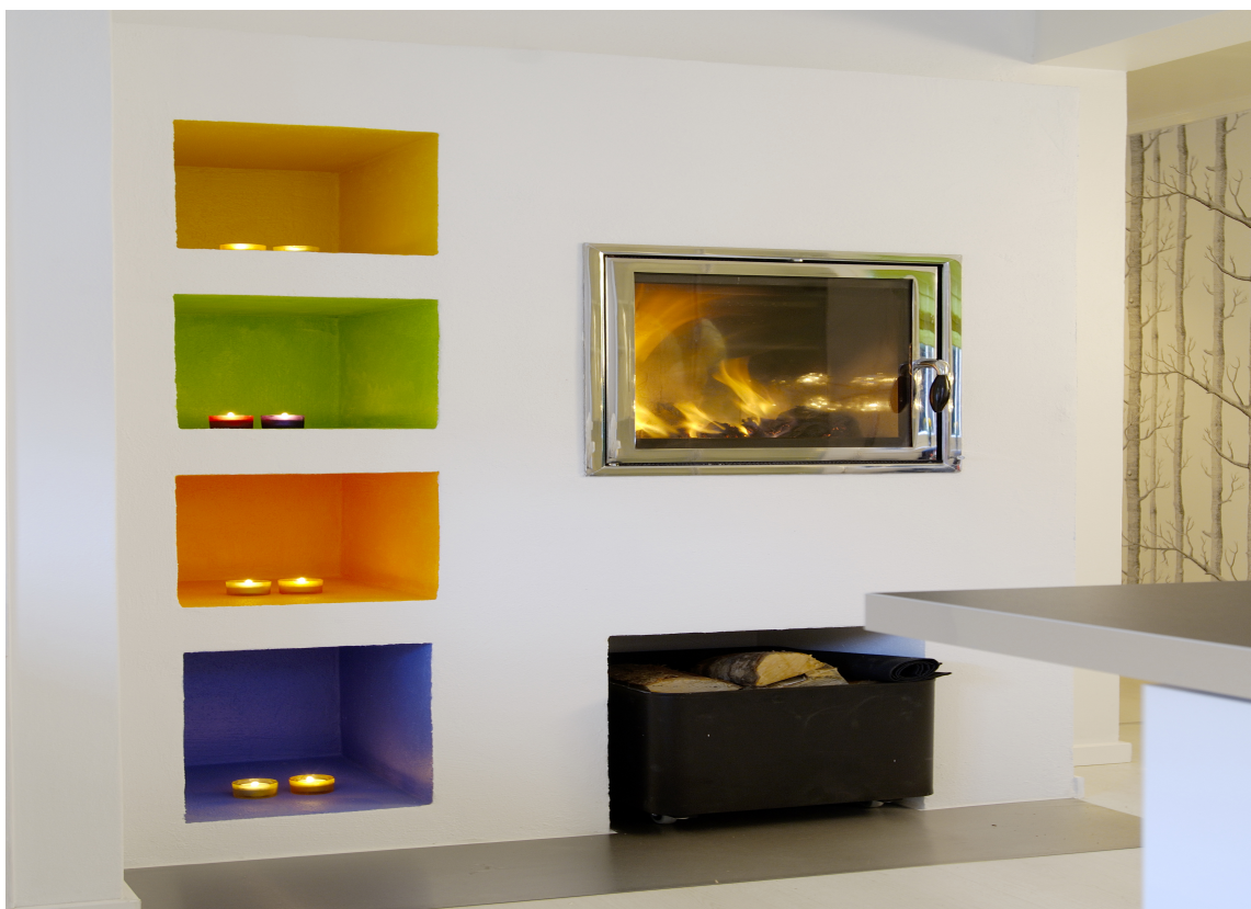
Fire nisjer i knallfarger. Når lysene tennes, reflekteres fargene og tilfører rommet spennende lys.