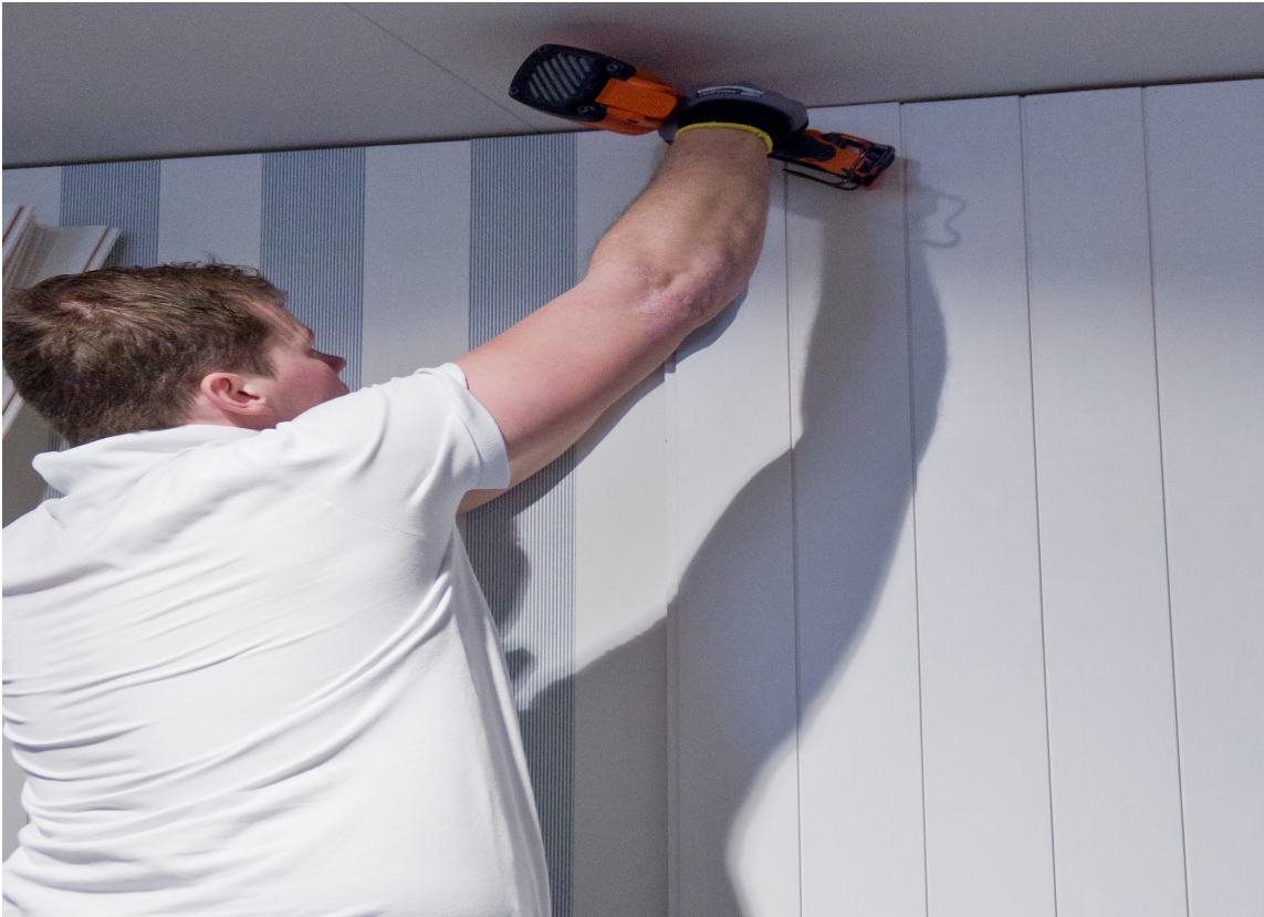
Kvistfri, forgrunnet panel er enkelt å montere.