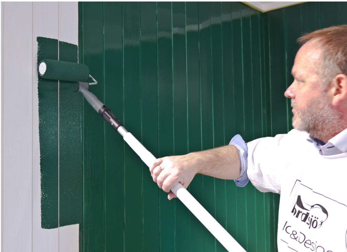
Bruk rull på forlengerskaft for å påføre maling på veggen.