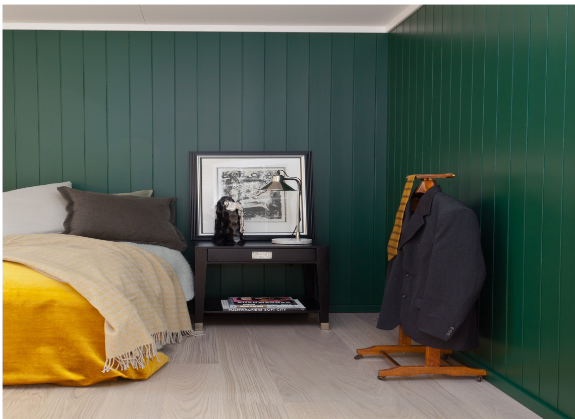
Etter to strøk har panelet en flott finish.