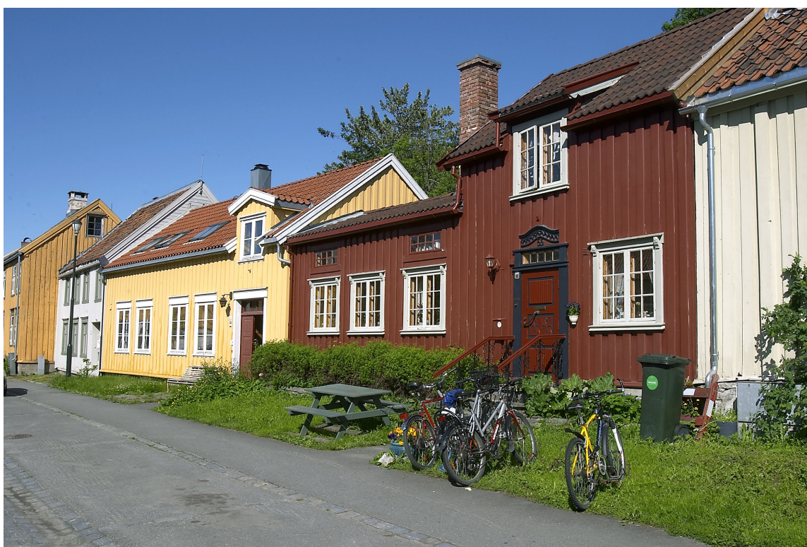
Se på fargene i nabolaget og velg en farge som gjør at helheten klinger fint sammen, tipser ekspertene.