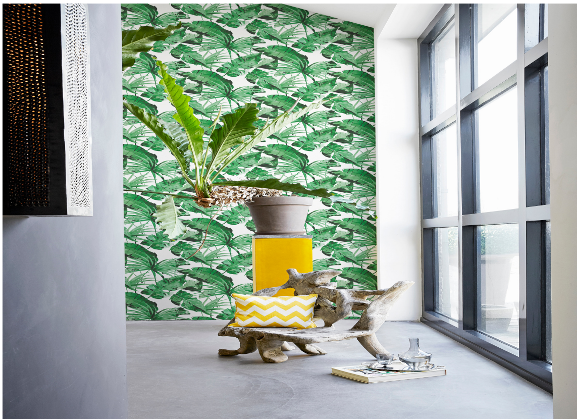
Eksotisk og grønt. Tapet fra Borge.