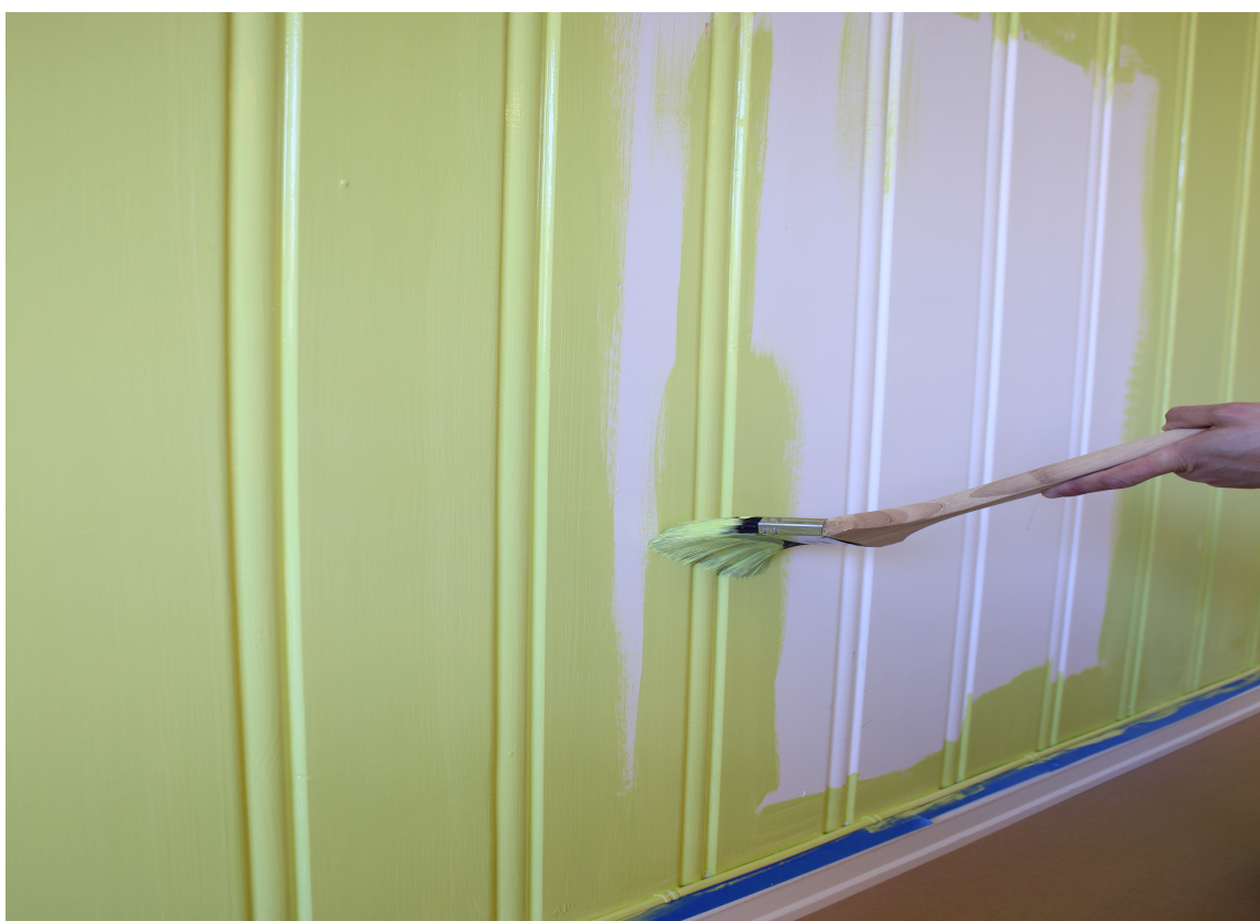
Maler du en vegg grønn, får du et skikkelig friskt blikkfang. Färgbygge naturmaling i fargen Kermit fra Miljømal.