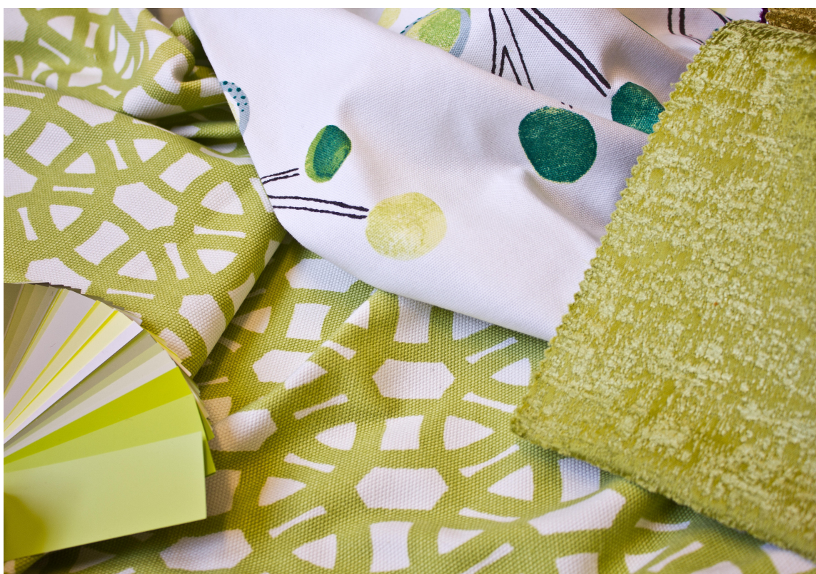
Tekstiler fra Tapethuset og en fargevifte full av muligheter.