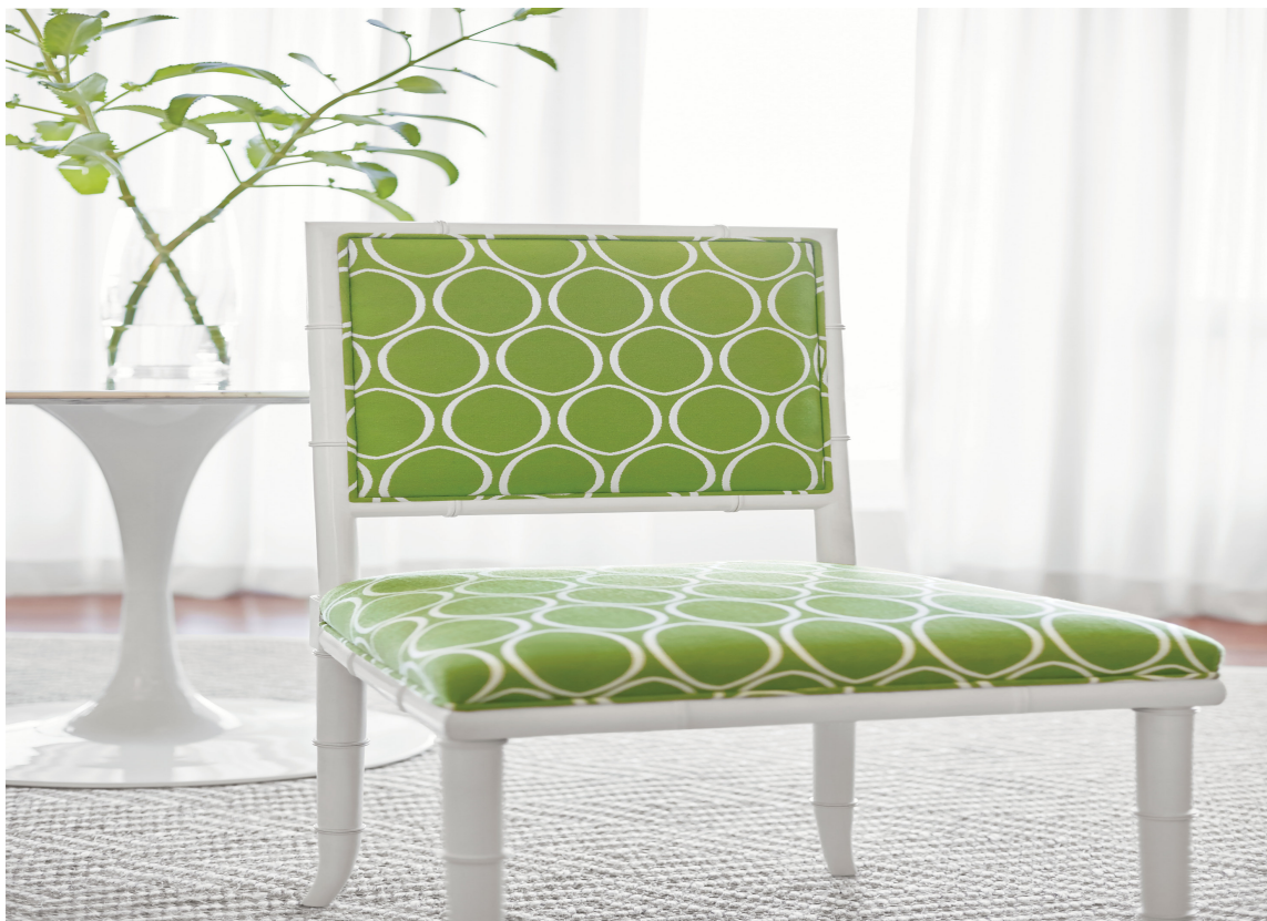
Stoff fra Thibaut til ute og inne. Føres av INTAG.

En gammel stol kan få nytt liv og skape sommerstemning med en drakt av hvitt og gulgrønt. Denne stolen er trukket med et stoff som er vann- og smussavstøtende og kan brukes både ute og inne.