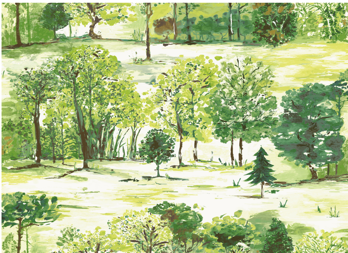
Lett og nordisk. Tapet fra Storeys.