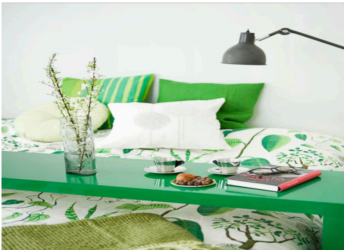
Bordet er malt med lakkfarge fra Beckers.