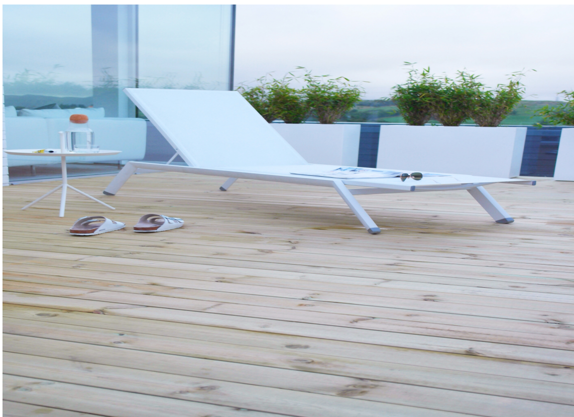
Bordene kan få lengre levetid med skjult innfestning.