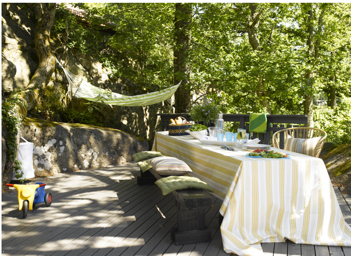
SOMMER OG SOL: En stor, hyggelig terrasse, hvor gulvet har fått sin farge fra fjellet som omkranser den.