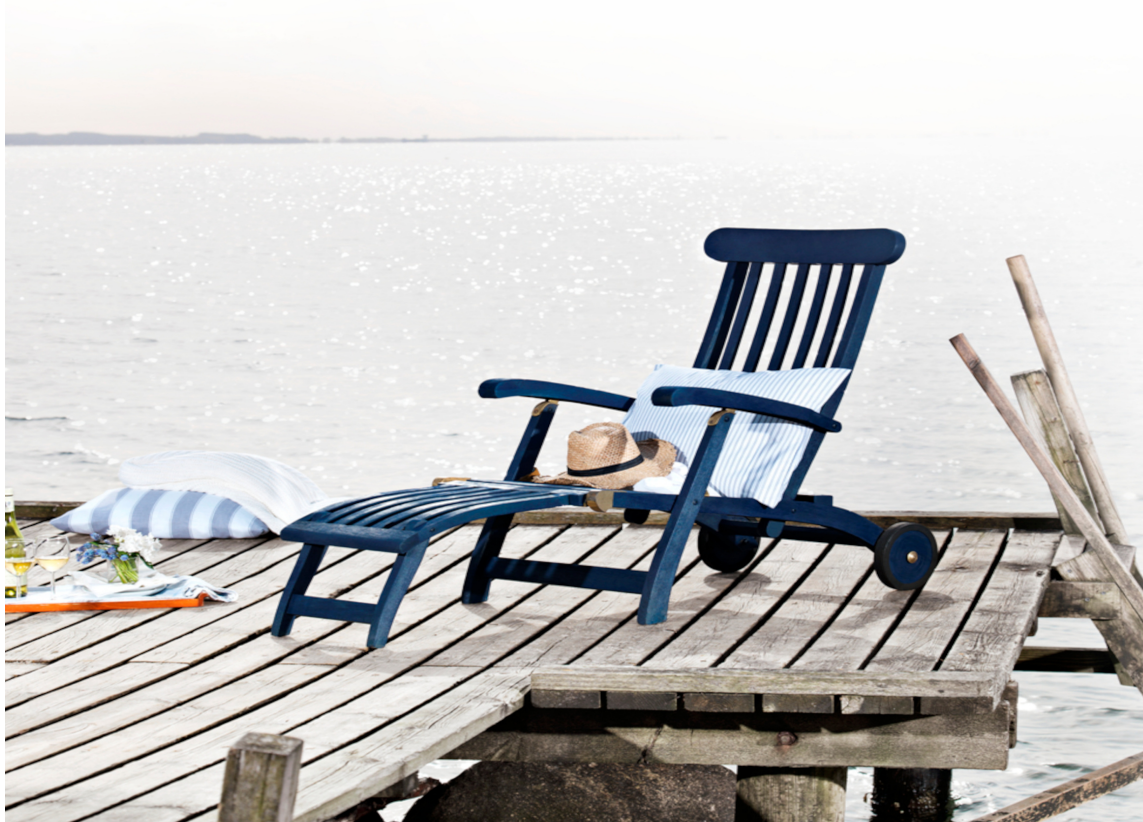
BRYGGEDAGER: Maritimt og sommerlig. Heldig er den som har en egen brygge som uteplass. Her har selve brygga fått være rustikk. Pass på så du ikke får flis!