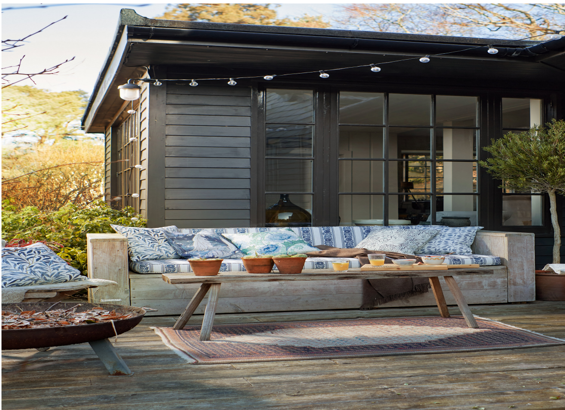
UTEPLASS: Lyslenke, fine tekstiler og litt planter gjør en hvilken som helst uteplass ekstra fin.