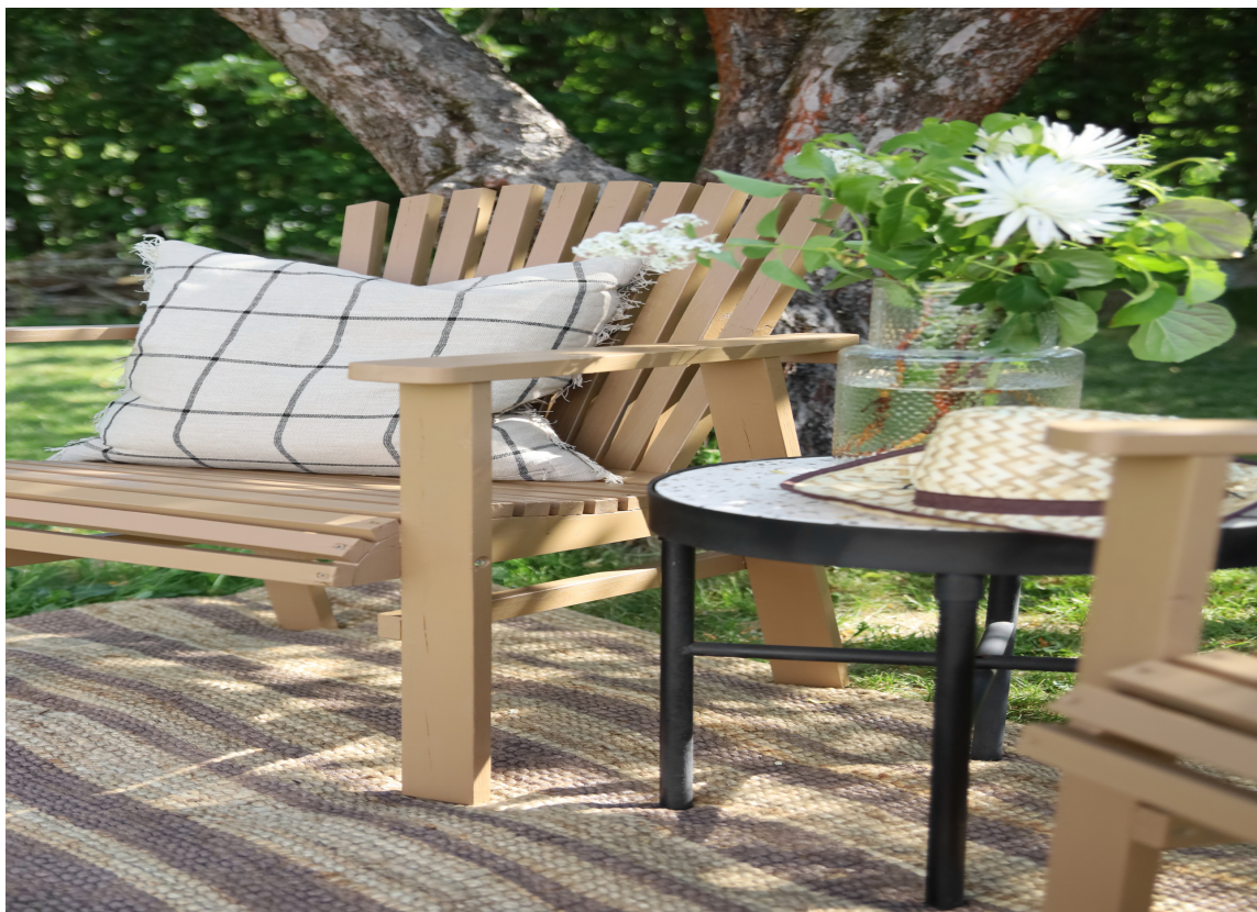
MALT: Gamle møbler blir nye med nytt strøk maling.