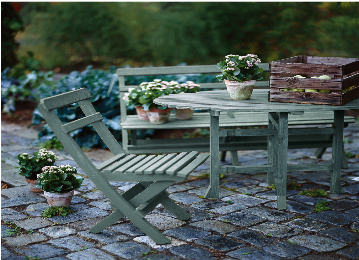
IDYLL: Vakre malte hagemøbler gjør noe med atmosfæren.