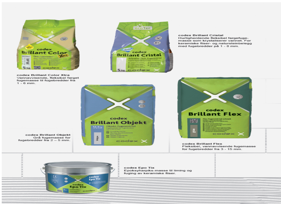
Farget fugemasse fra Codex.