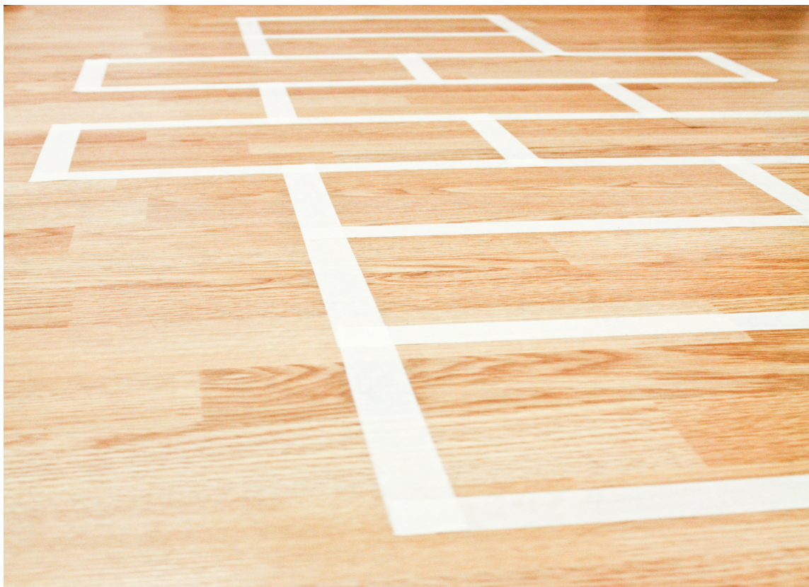
Paradis er moro for de små!

Det er heller ikke bare paradiset du kan lage på gulvet - hva med en bilbane, eller kanskje navnet til poden? På barnerommet er det lov til å slå seg løs.