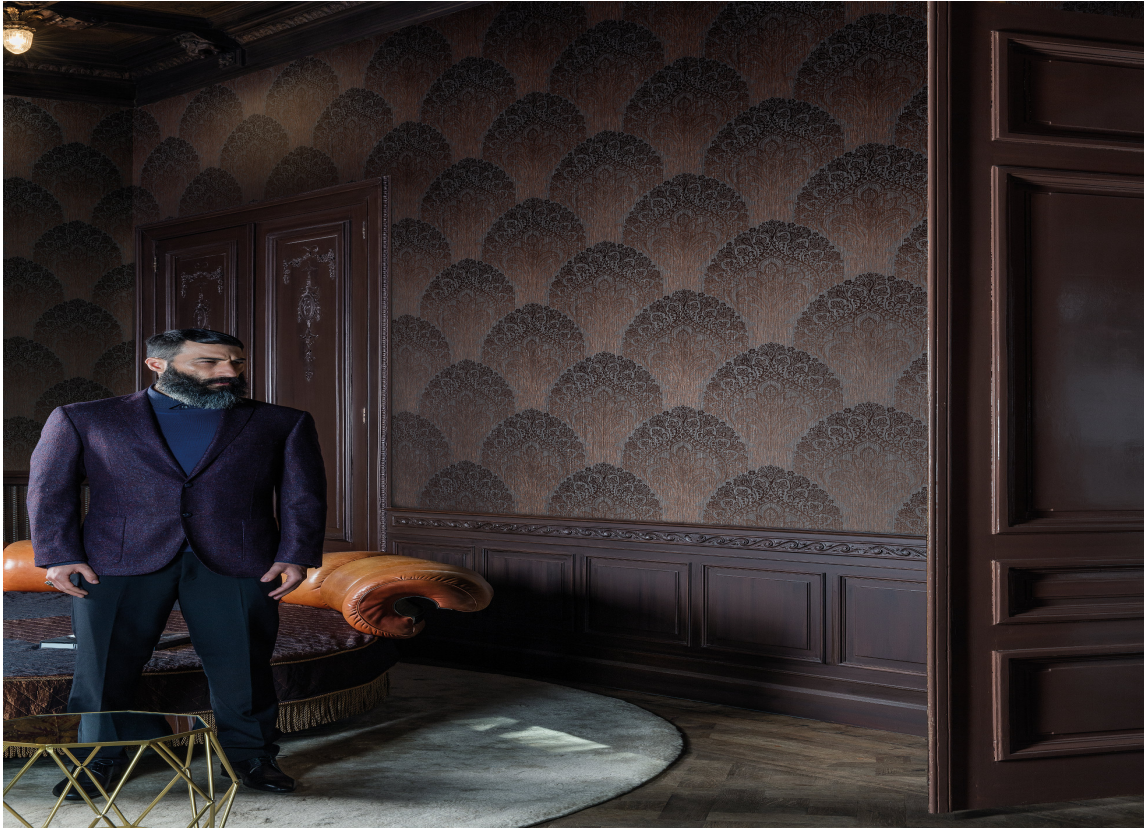
Spectrum er et kraftig vinyltapet med tre vaskebølger fra Fantasi Interiør. Det kommer i flere ulike mønstre i fargene hvitt, rosa, grått samt petroleum, brun og sort.

Vinyltapet finnes i mange forskjellige utførelser og utseende. Noen er kraftige og kan ha preget struktur i overflaten. Andre er tynnere og mer smidig. Det finnes også varianter som til forveksling ligner papirtapet, men et tynt vinylsjikt gjør dem mer slitesterke og enkle og holde rene.