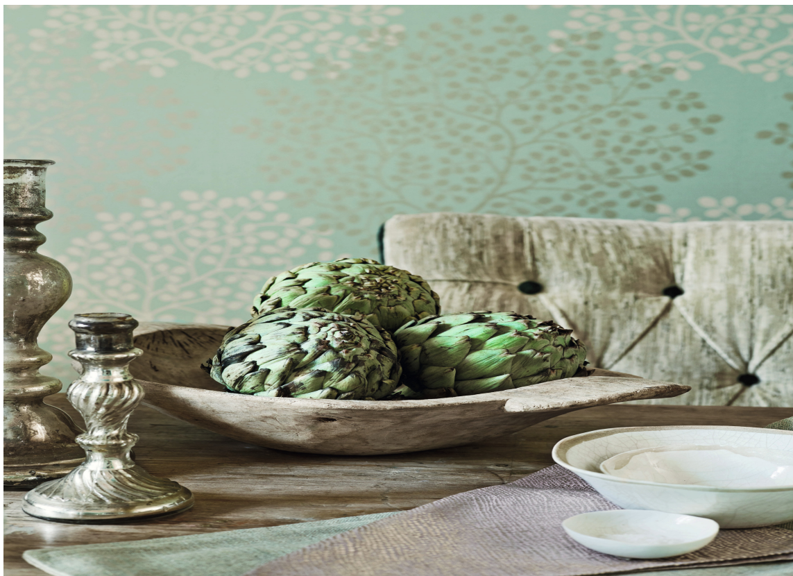
Hos INTAG fant vi Lindos fra Sanderson, også er et vinyltapet med tre vaskebølger. Dette designet finnes i flere farger, alle fint avstemt ton-i-ton og et lite skimmer av sølv.