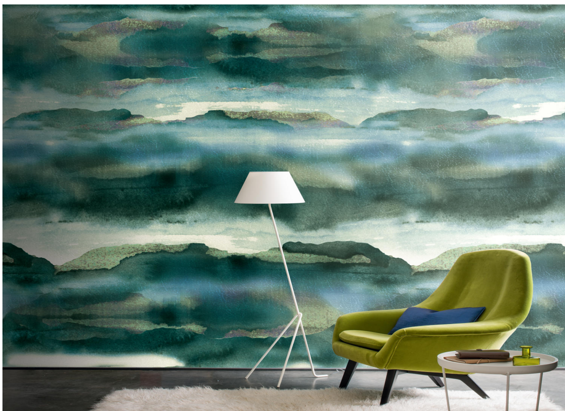
Kolleksjonen Copper fra Casamance føres av Green Apple. Dette er et vinyltapet med fiberbakside, og tre vaskebølger. Designet finnes i flere farger.