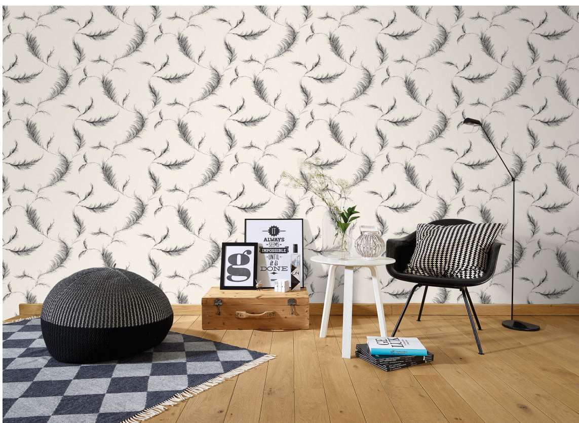
Lucia er en av bestselgerne hos Storeys, et vinyltapet som kan skrubbes. Kvaliteten finnes i flere design og farger.