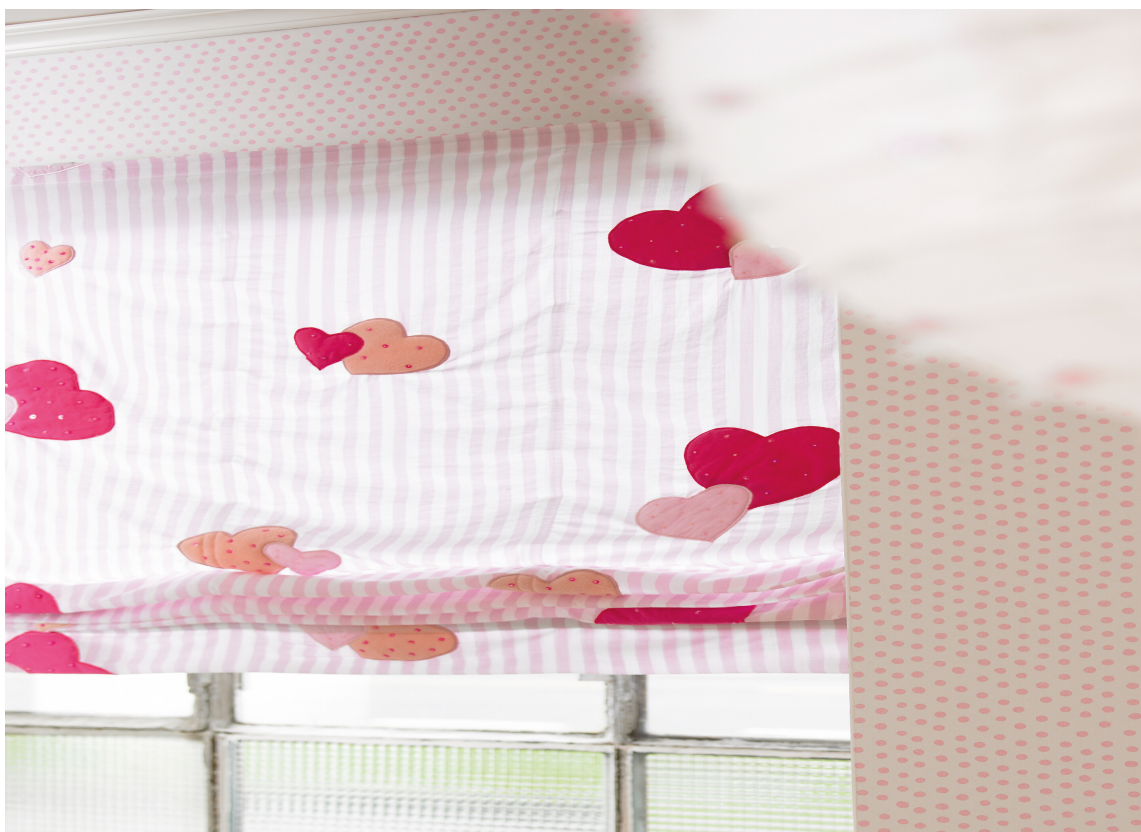
Striper, prikker og hjerter i rosa og hvitt – ikke for mye og ikke for lite.