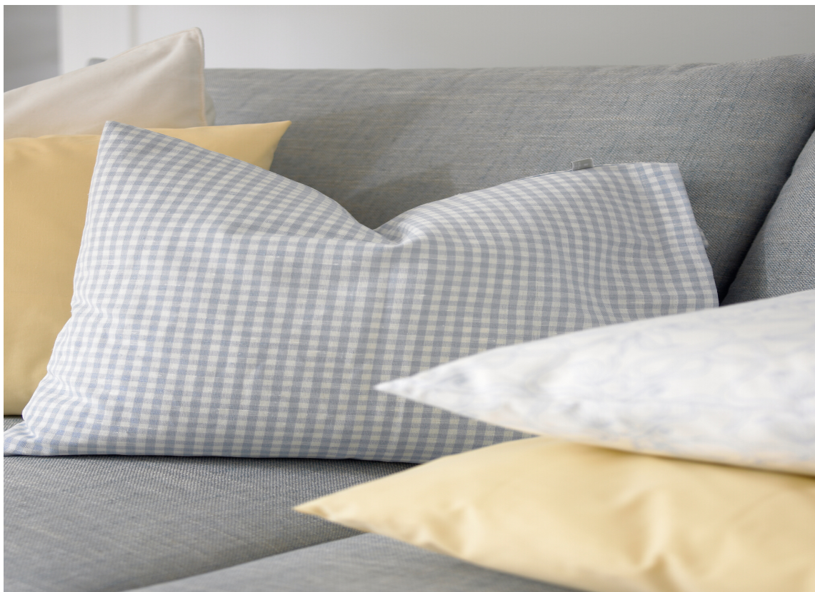
Tekstiler i ulike kvaliteter med duse toner, rutemønster og ensfarget forsterker det milde og myke uttrykket.