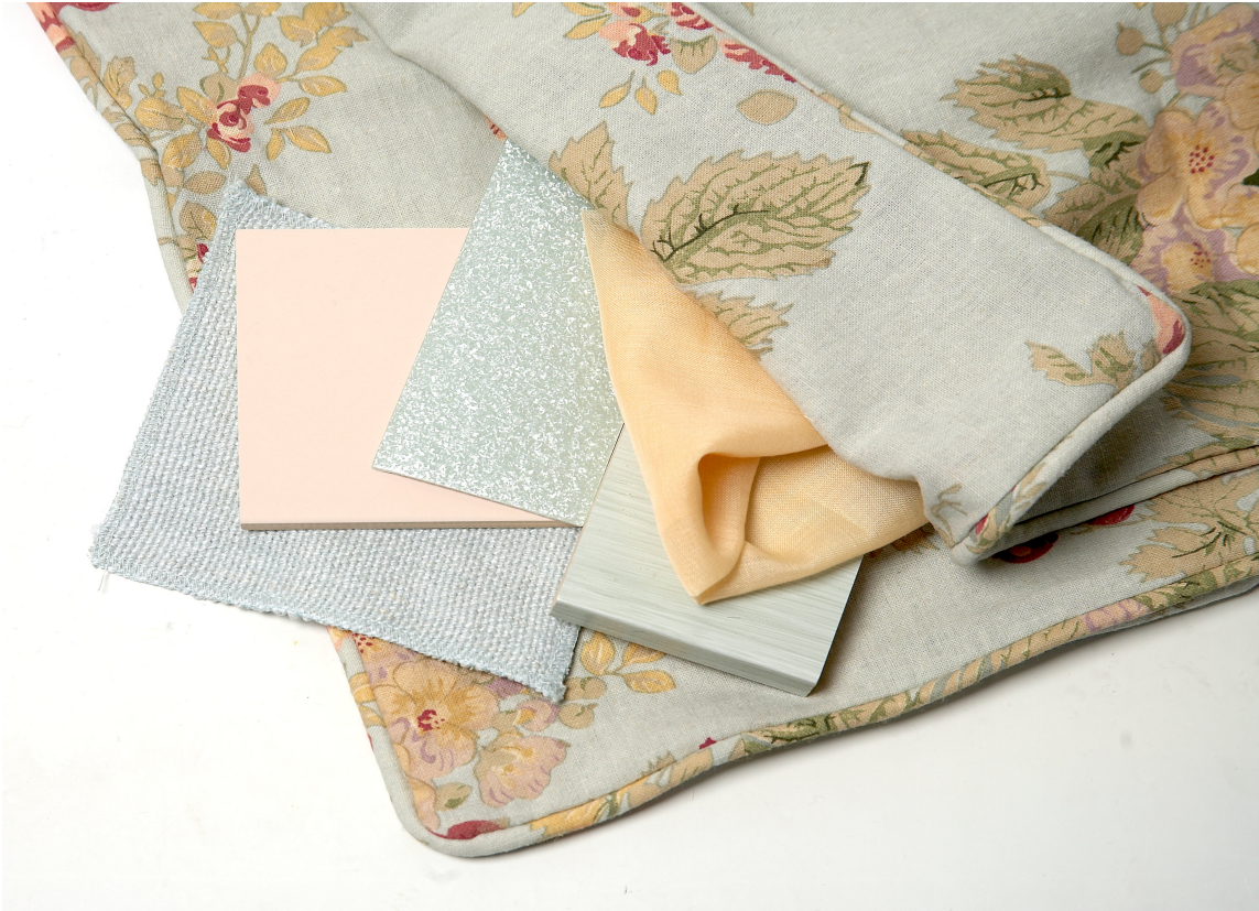
Lyse, dempede nyanser.