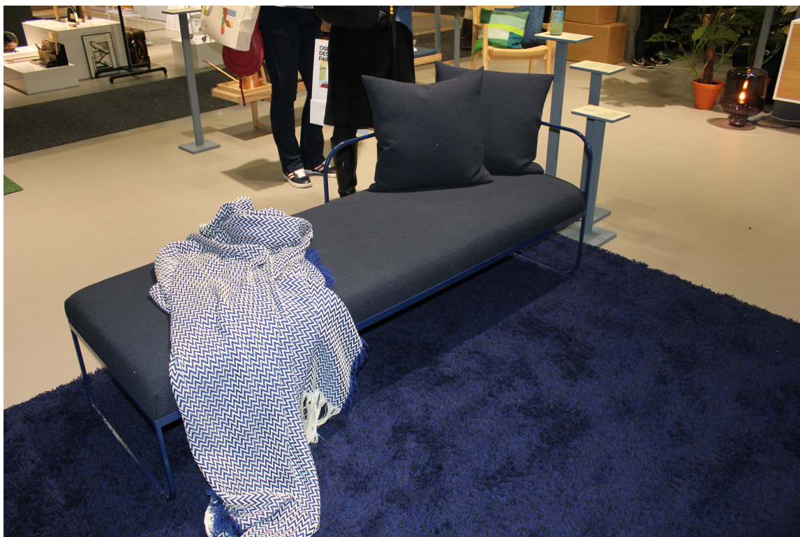
Bonytt viste god, norsk design til flere rom på Oslo Design Fair; i blått.