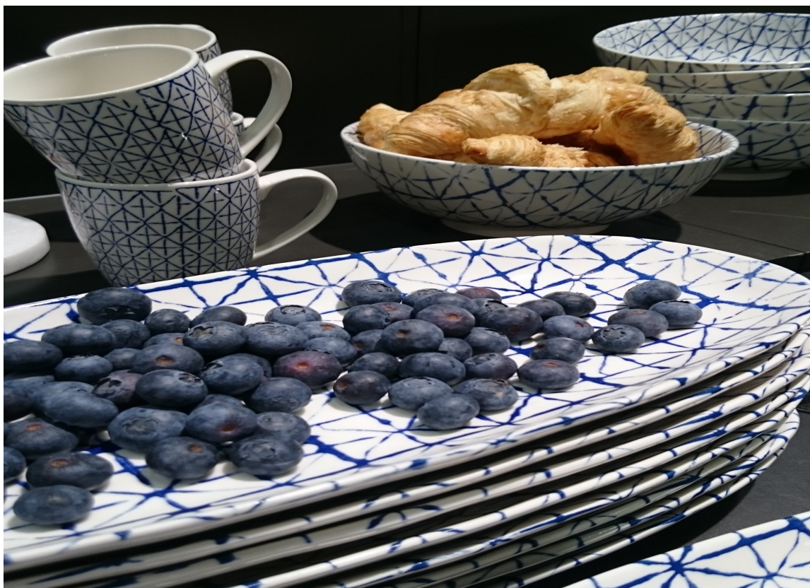
Blå og hvit hverdagskos presentert på Oslo Design Fair.

varespekter – også i blått. Det ble handlet flittig, og vi gjetter at det blir mye blått å se i ulike nyanser.