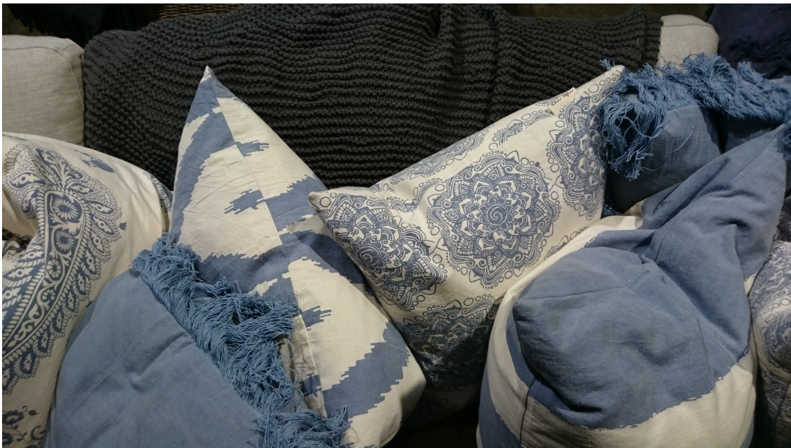
Vi nordmenn elsker puter, og det var mengder av dem på Oslo Design Fair, også i blått.