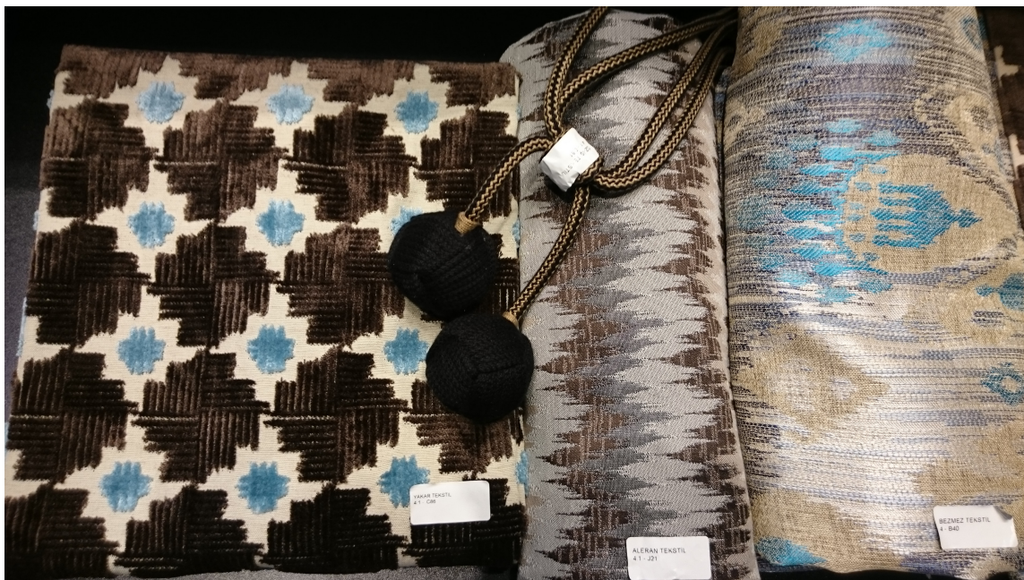
Blått kler mange farger. På Heimtextil bugnet det av fargerike tekstiler, her er blått i kombinasjon med brunt.