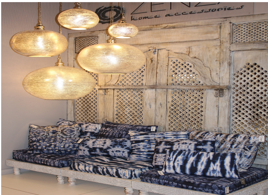
En blå sofa trenger ikke være ensfarget.