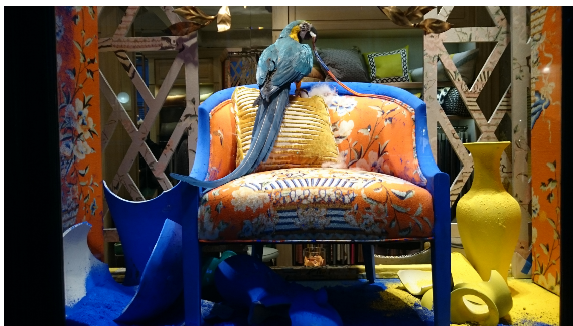
En runde med vindusshopping i Paris byr også på friske blå opplevelser.