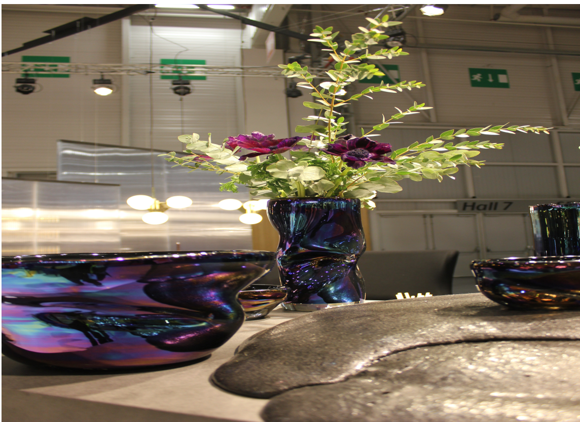
Populære Tom Dixon var også i Paris med blått, nye vaser med overflate som minner om olje på vann.