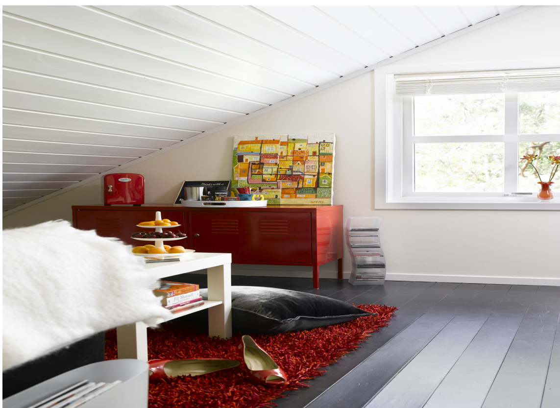
Et fersht, lyst rom med gode farger, og takket være den høye glansen på tak og gulv reflekteres lyset både til hygge og nytte.