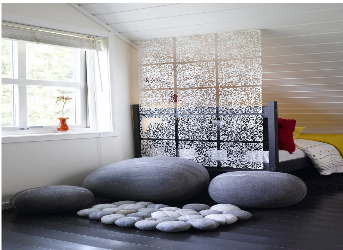
Sovedelen er adskilt på en smart måte, innunder skråtaket. Puffer i steinlook sørger for ekstra sitteplasser.