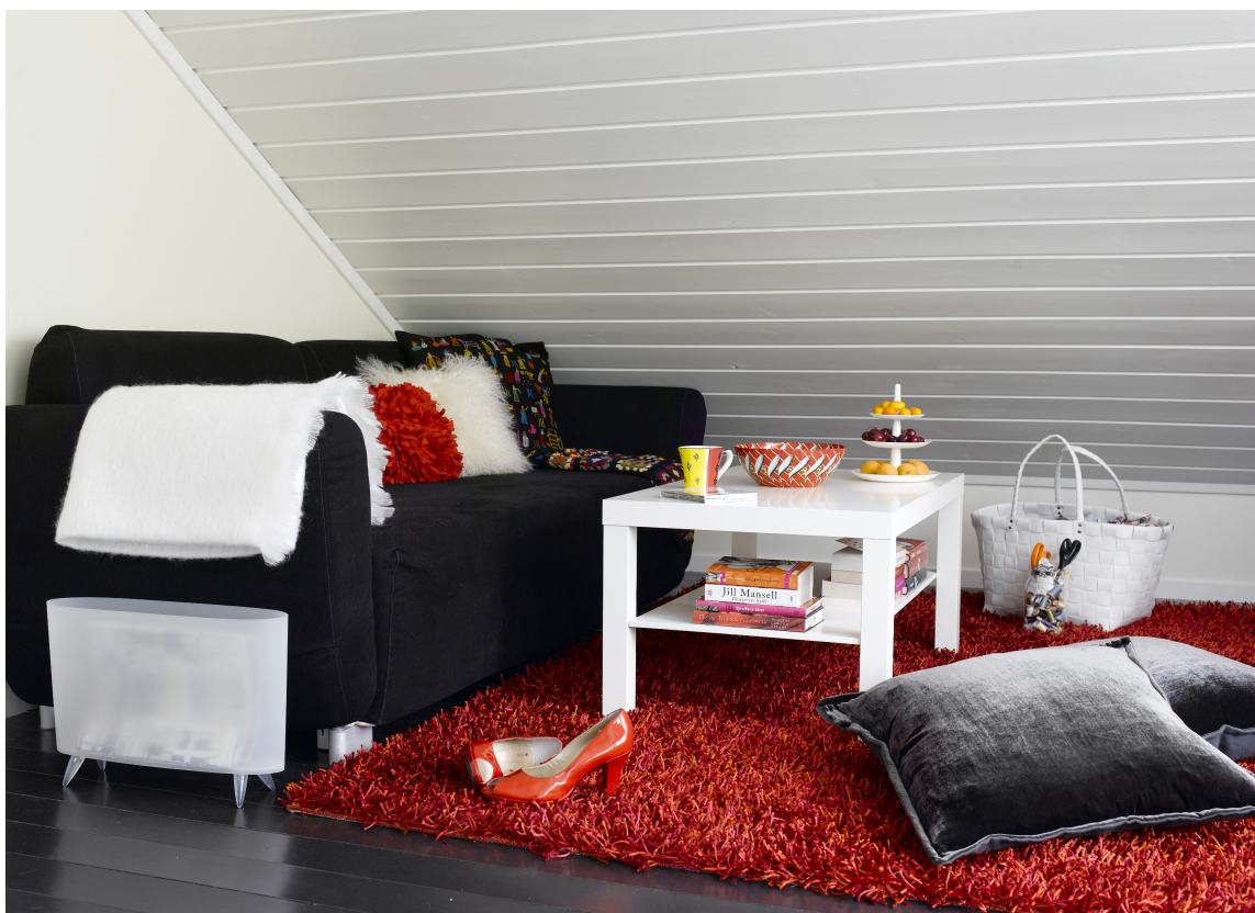
Rom med lave knevegger er en utfordring, både med tanke på møblering og fordi taket går så langt ned. Her vokste romfølelsen i takt med at taket ble hvitt.