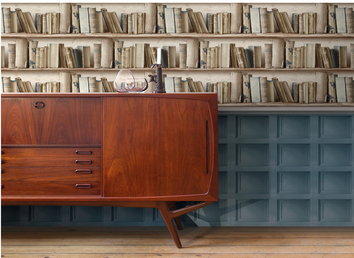
I retningen som kalles Metrounban er det viktig med kvalitet fremfor kvantitet. Det er få støvsamlere i denne retningen.