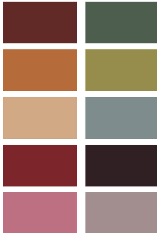
Fargepalett for Metrounban. Aksentfarger til venstre og hovedfarger til høyre.