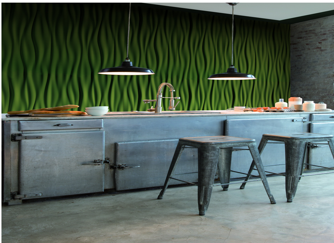
Selv om personligheten ligner litt på Sofistikert Eleganse i stilen, er denne retningen mer leken og fargerik.