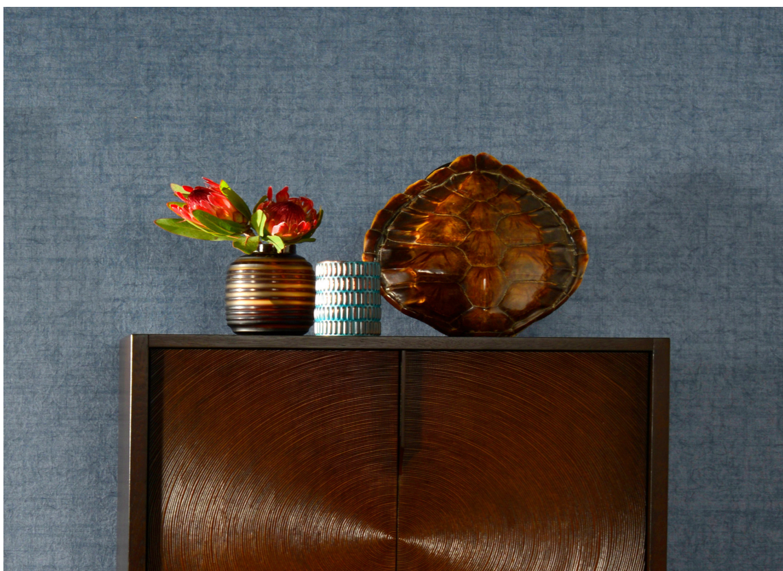
Mørke tresorter og mettende farger gir et lunt uttrykk.

Uttrykket er androgynt og urbant. Atmosfæren virker dempet, rolig og varm. Det er lite nips og unødvendige «støvsamlere». Her trives stilikoner og løsninger som tåler tidens tann. Innslag av retro gir assosiasjoner til 50- og 60-tallet, men kombinert med «tegnaseriekunst» og mer rustikke innslag blir atmosfæren røffere, lunere og mindre stram.