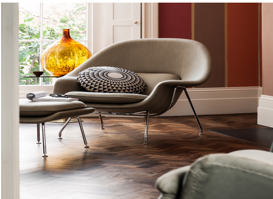
Mørke gulv lagt i fiskebein er typisk for den Metrourbane retningen.