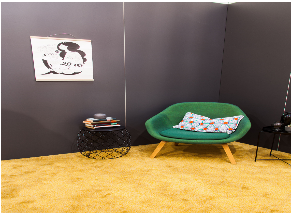
Mange vil nok kjenne igjen fargene fra 70-tallet.