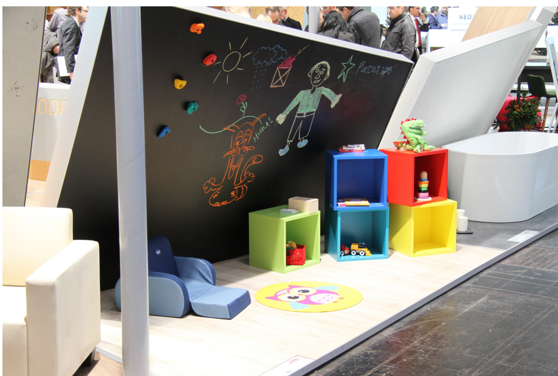
Hva med et krittgulv som ungene kan tegne på?