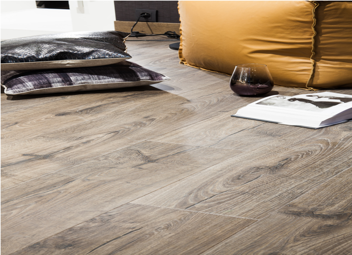
Mørke flater var også å se på messen.