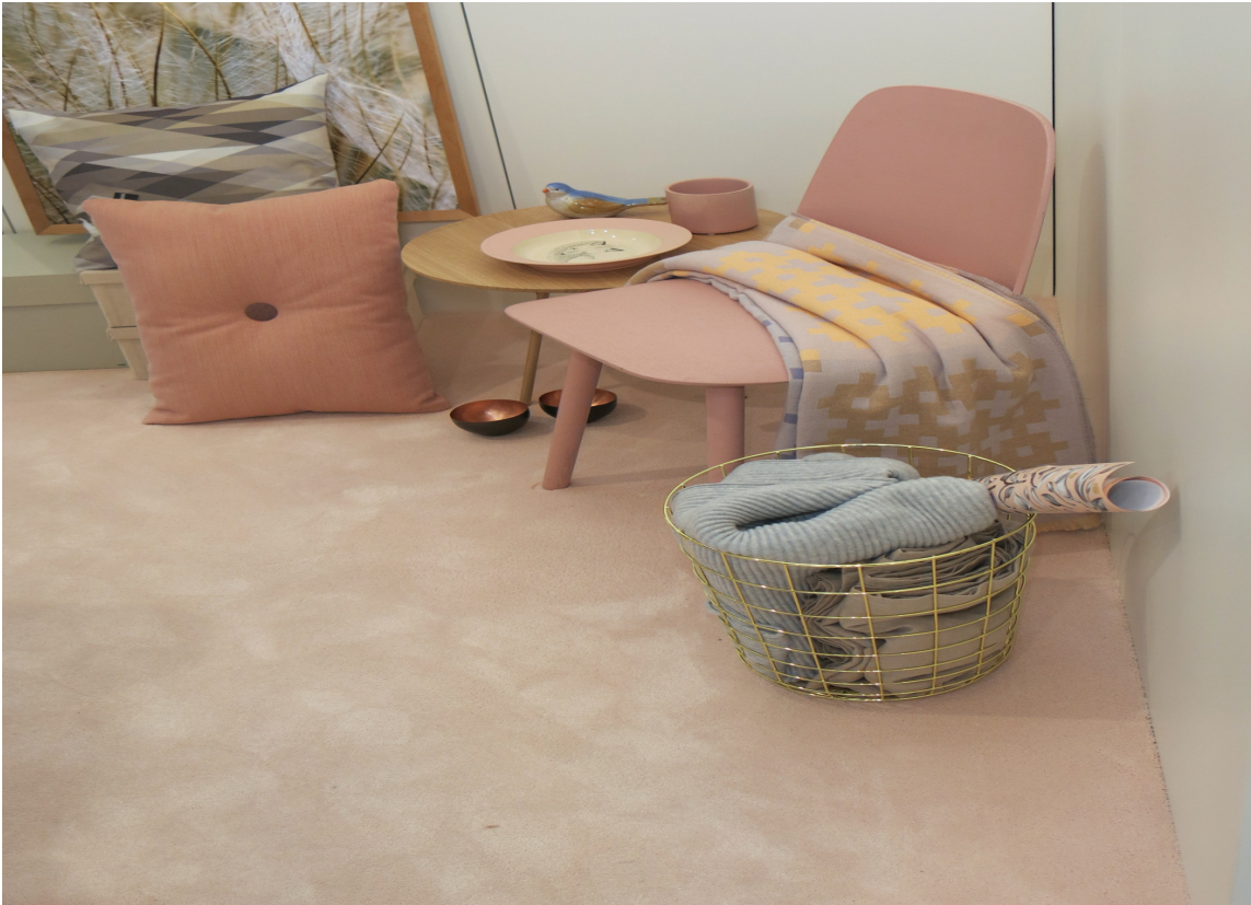
Myke, lune og duse rosafarger ble presentert som en trend på messen i Tyskland.