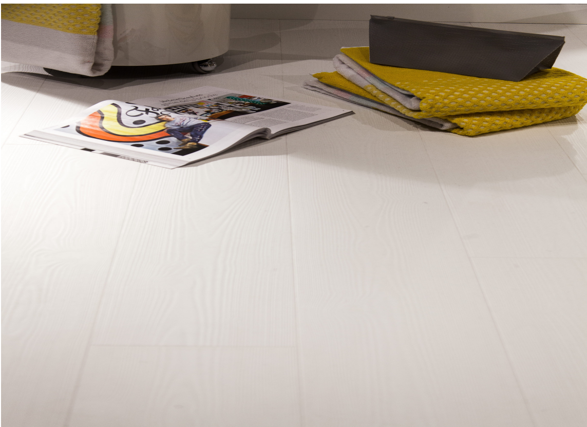
Hvite gulv er rene og pene og gir et delikat inntrykk.