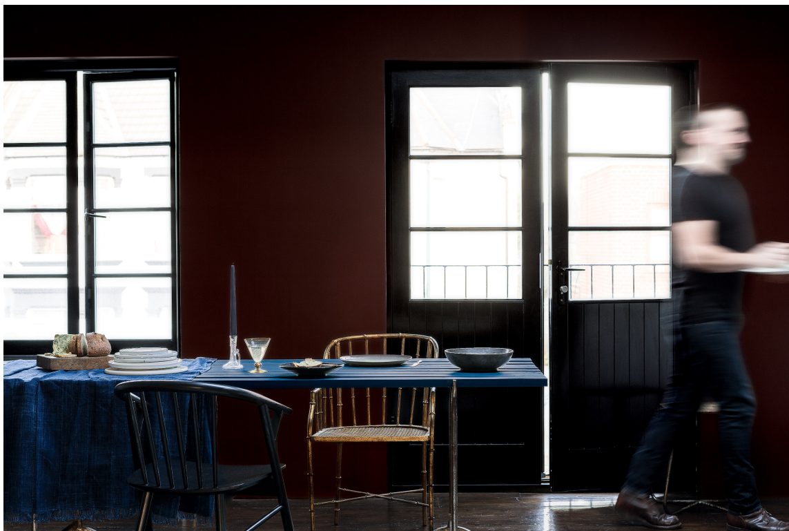
Dype sortaktige farger ton-i-ton uten innslag av sterke kontraster er vesentlig for helheten. Farger fra Nordsjö.