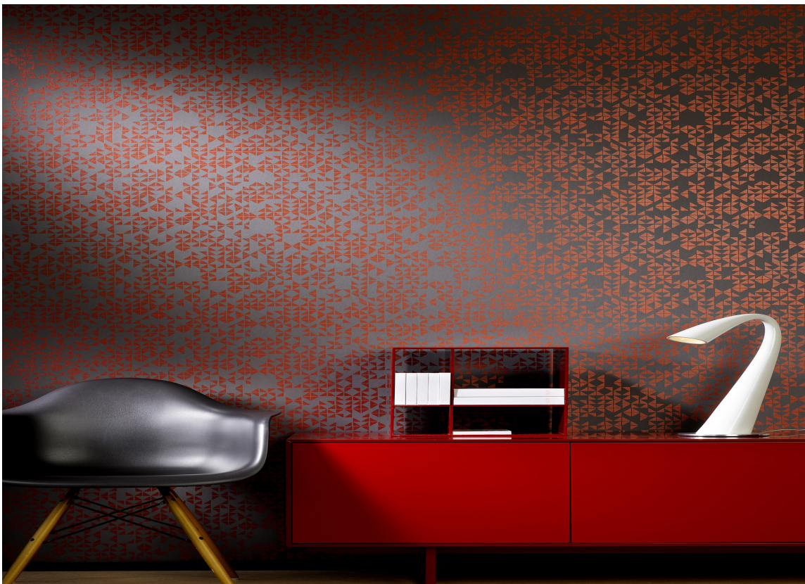
Rødt og gull er godt følge for å skape litt kontrast i den ellers dempede paletten.

Uttrykket er dempet og rolig, kontinentalt, klassisk og elegant. Det er rene, myke linjer og store former. Volum og symmetri er vesentlig for å skape den riktige helheten. Lampene er store og de er to der det er riktig. Her er det lite ferieminner, familiebilder og andre personlige klenodier. Kunst og gjenstander skal behage øyet og understreke stilen, mer enn å fortelle personlige historier.