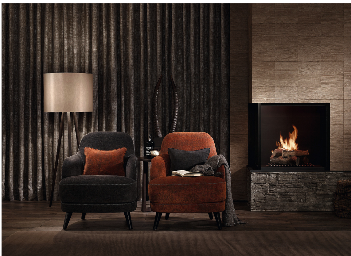
Rene myke linjer, dempede farger og tekstiler bidrar til en sofistikert og elegant atmosfære. Tekstiler fra INTAG.