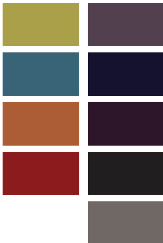
Fargepalett for Sofistikert Eleganse. Aksentfarger til venstre og hovedfarger til høyre.