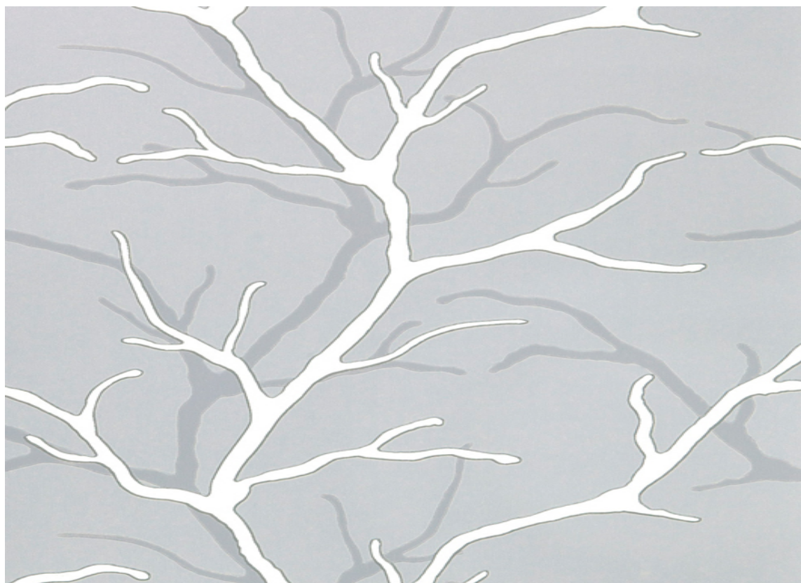
Naturmotiver har alltid inspirert oss. Her er et tapet fra Storeys.