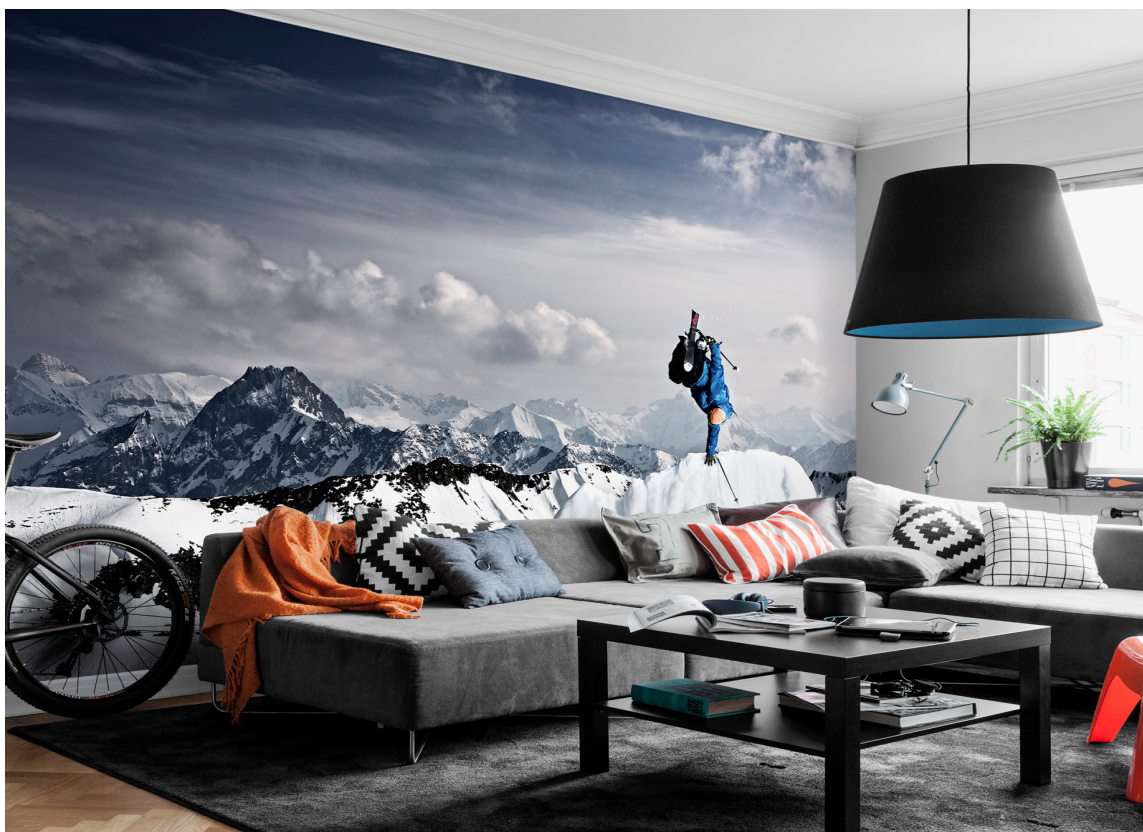
Bli inspirert av vinteraktiviteter, som med dette fototapetet fra Mr Perswall.