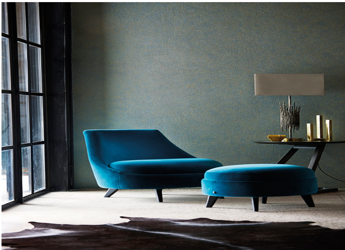
Noen ønsker kanskje å trekke seg tilbake på vinteren, med mørke farger, inspirert av den koselige innestemningen.