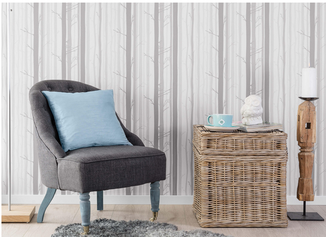
Også Storeys kan by på tapeter inspirert av motiver fra naturen.