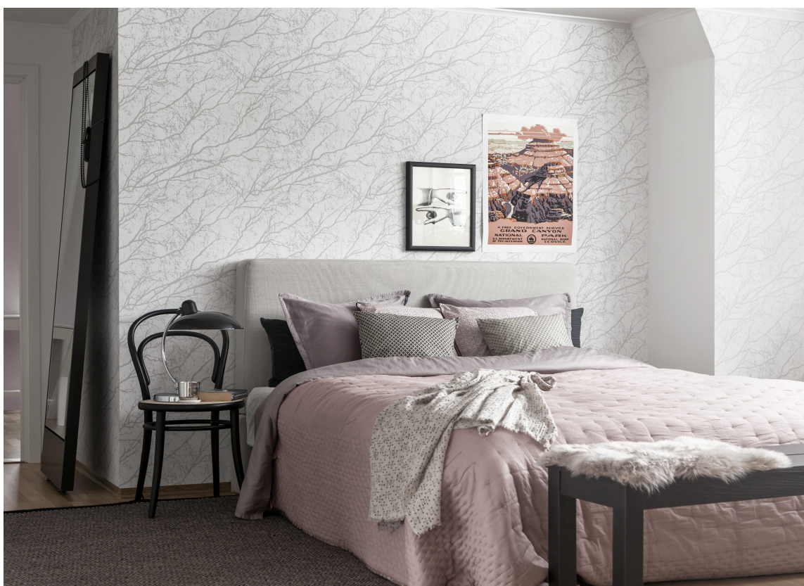
Nakne kvister er et motiv som går igjen, og som man kjenner igjen fra vinternaturen. Her er et tapet fra Borge.