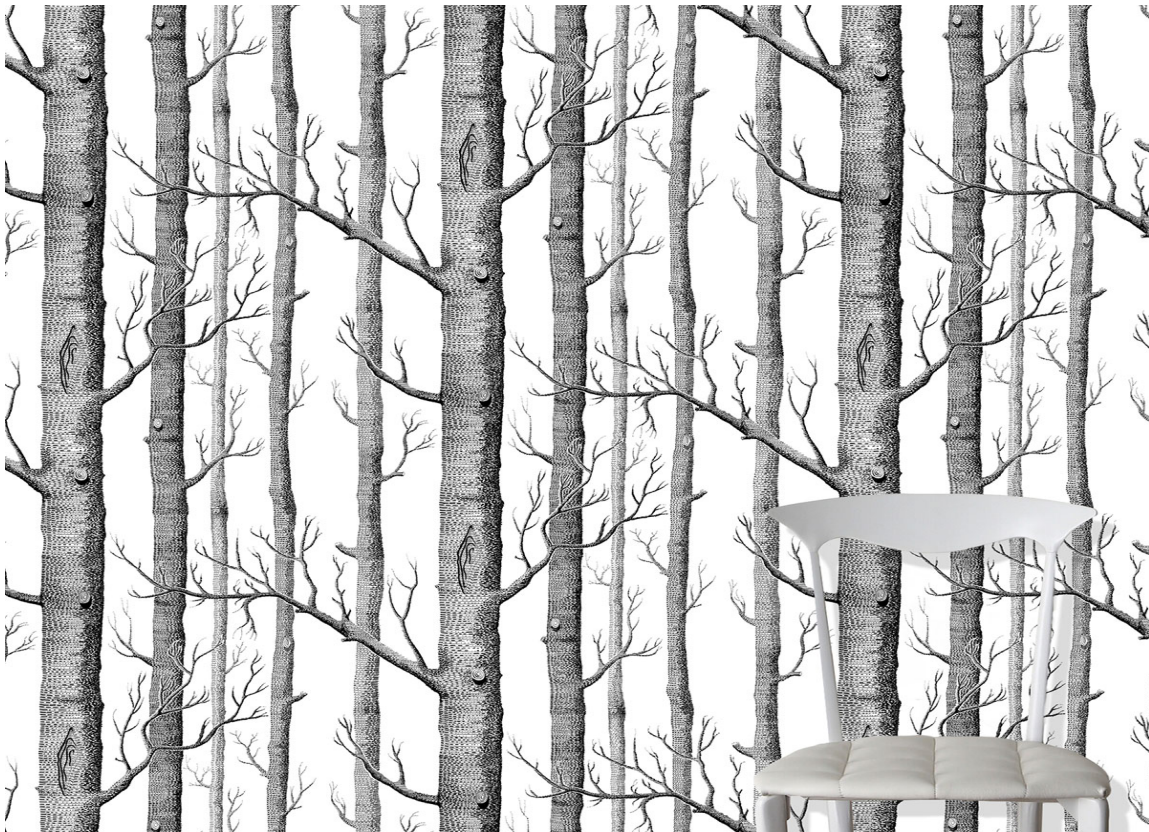
Bjørketapetet er jo en klassiker. Her er et tapet fra Cole & Son.