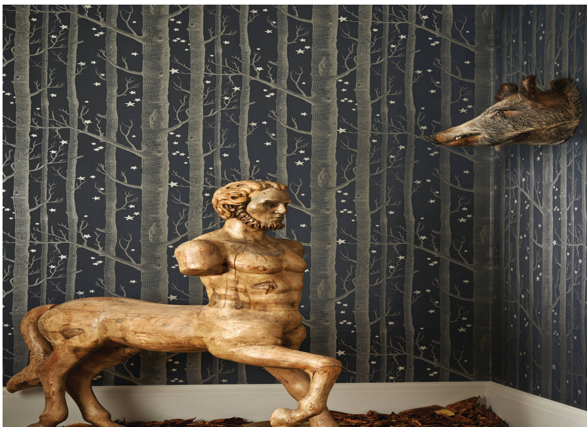
Trekk deg tilbake i huset, med mørke farger i vinterkulden. Det klassiske bjørkemønsteret til Cole & Son gir her en helt annen atmosfære. Perfekt til peisstemningen.