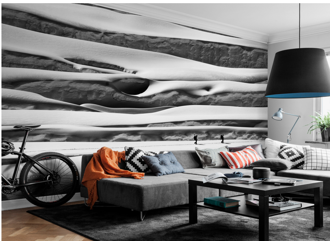
Du kan laste opp egne bilder av vinteraktiviteter eller naturmotiv på Mr Perswall.no