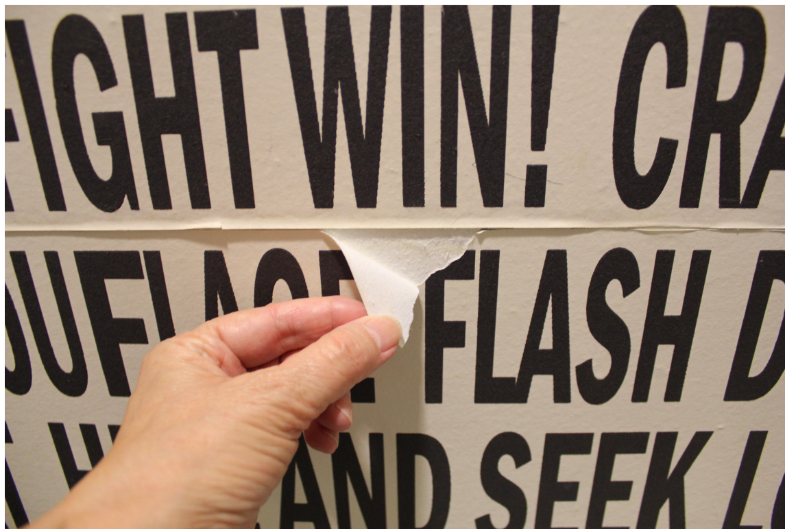
Når tapetet er spaltbart, er det enkelt å fjerne det ytterste laget.