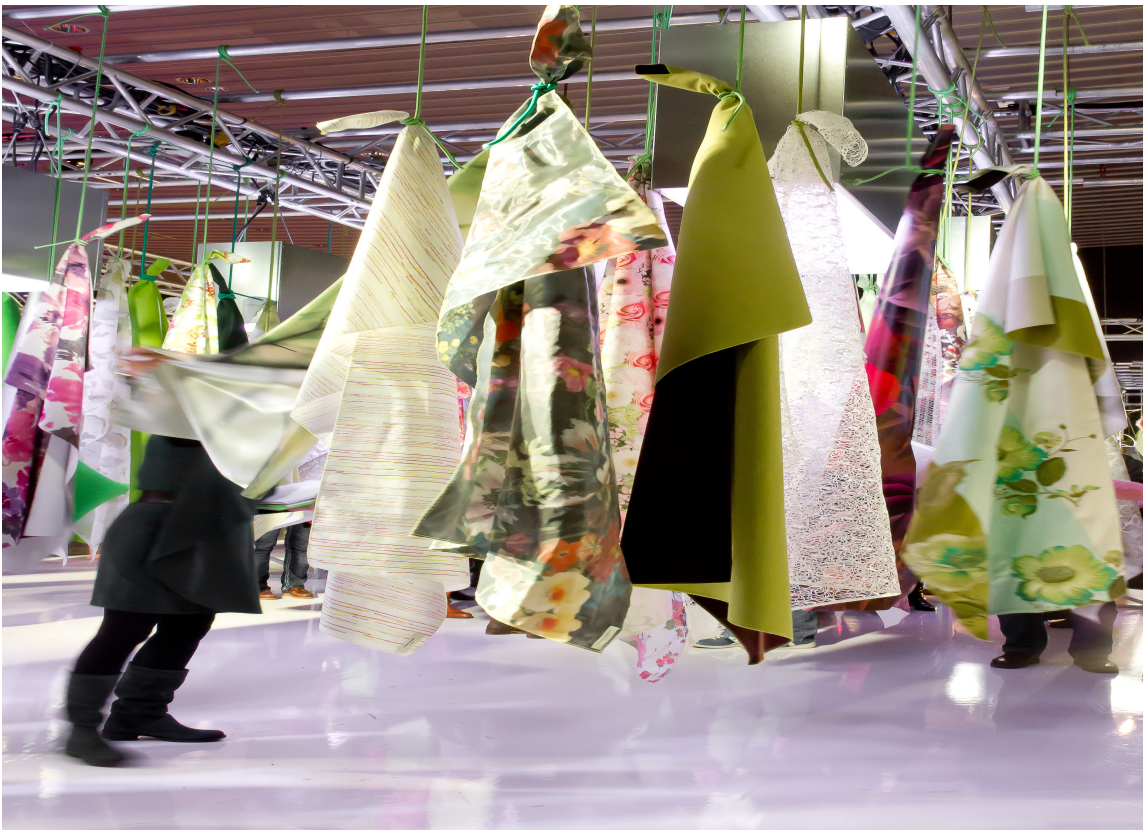
Trendsettere finnes overalt, i alle miljøer.