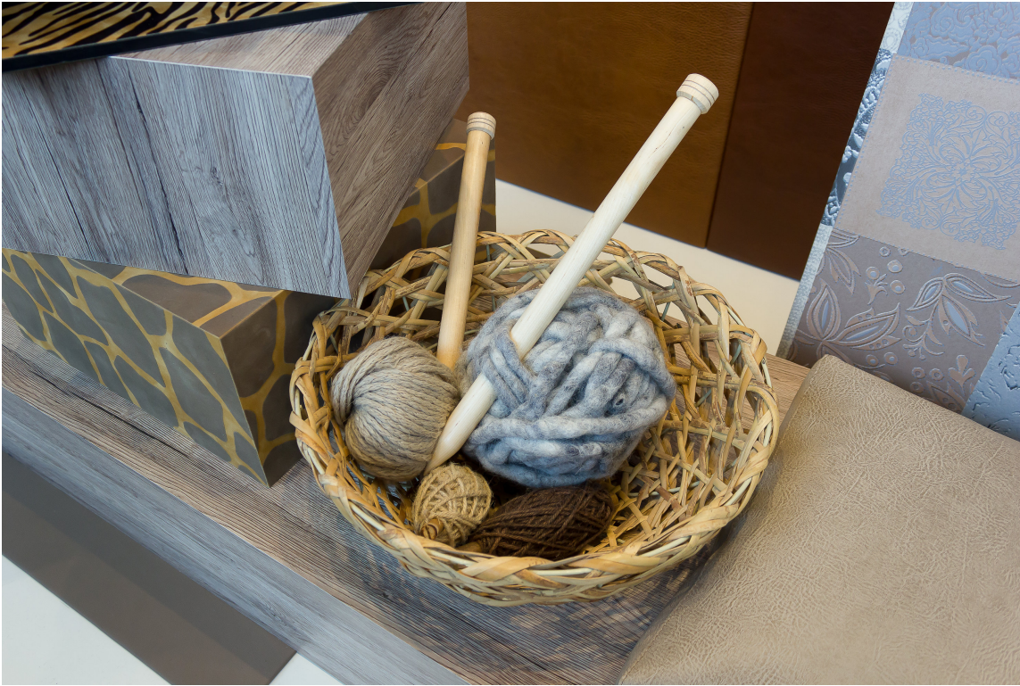
Kanskje trives du best med det vante?