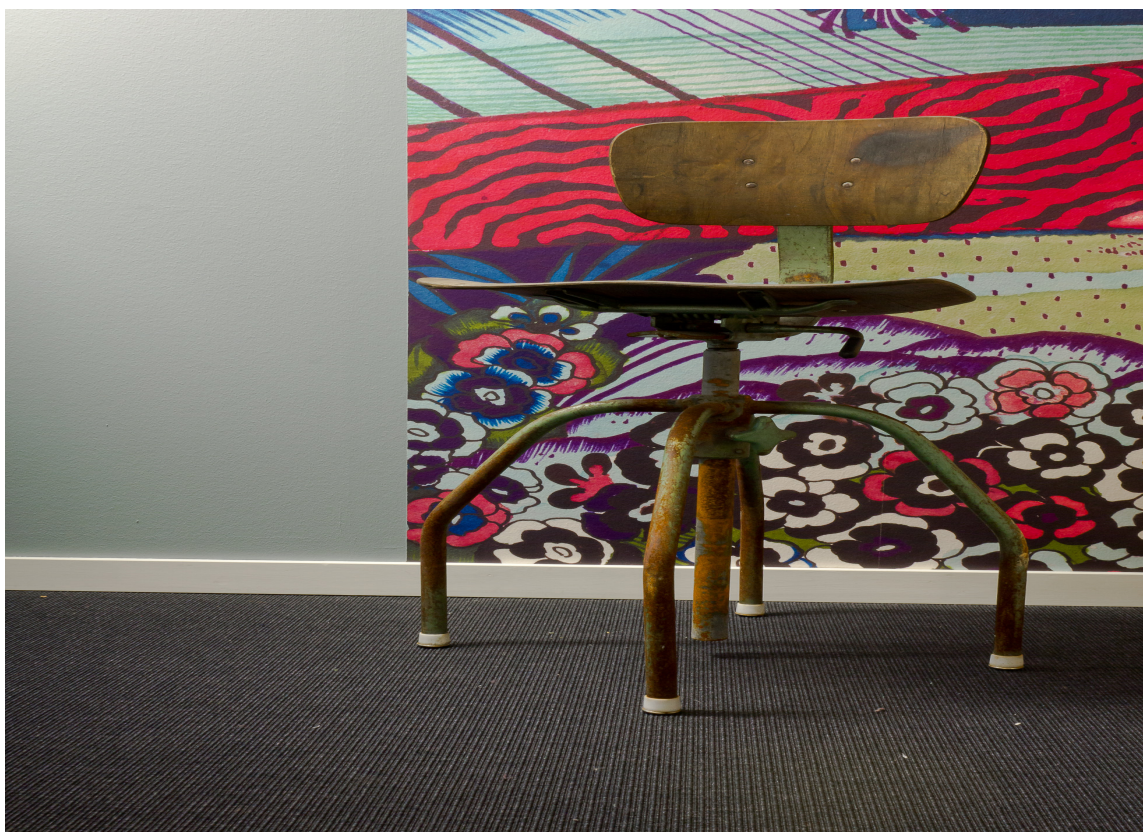
Resultatet er en veggfarge som passer bedre med tapetet, og ingen maling har havnet på fototapetet.