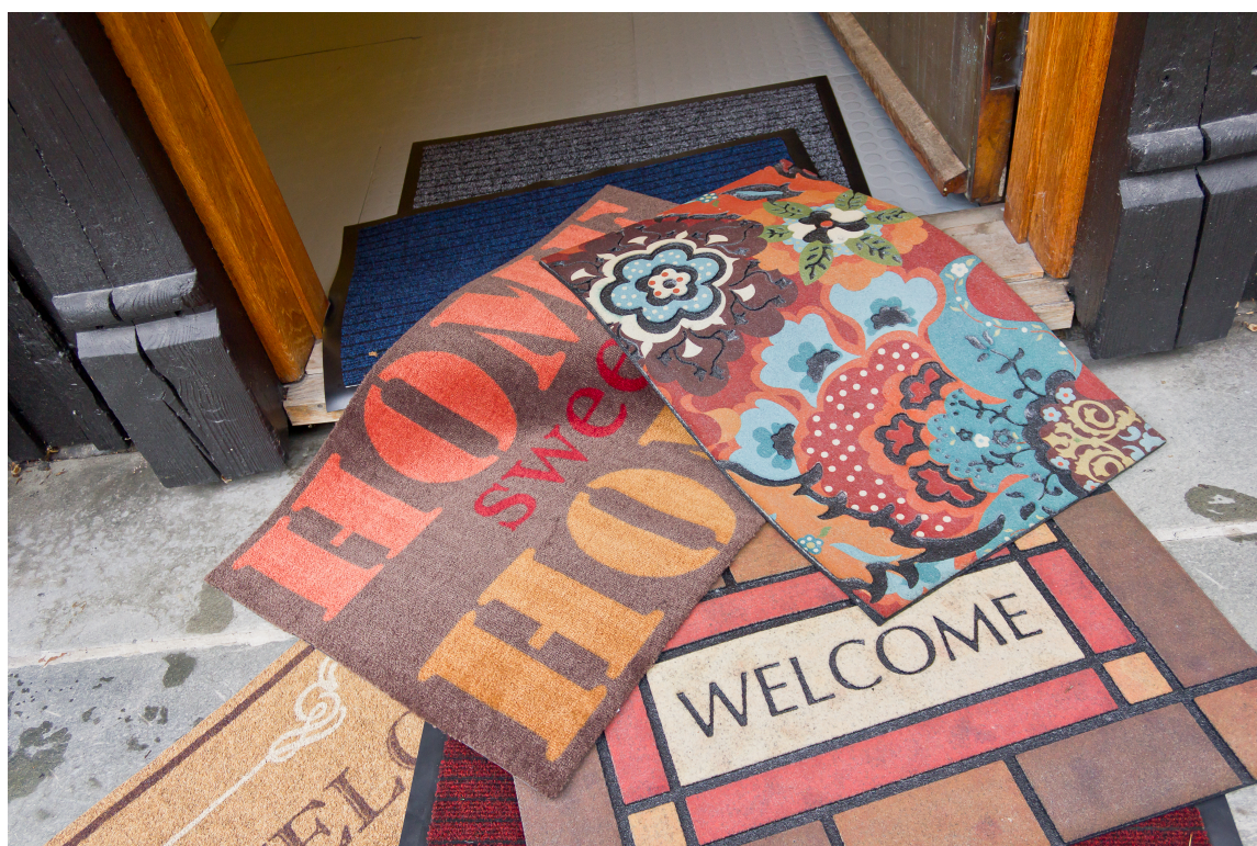
Det finnes flere typer dørmatter. Et godt entrémattesystem stopper omtrent 90 prosent av skitten allerede i døren. Når fukt og skitt ikke kommer lenger enn som så, sparer du deg for mye rengjøringsarbeid og øker levetiden på boligens gulv.