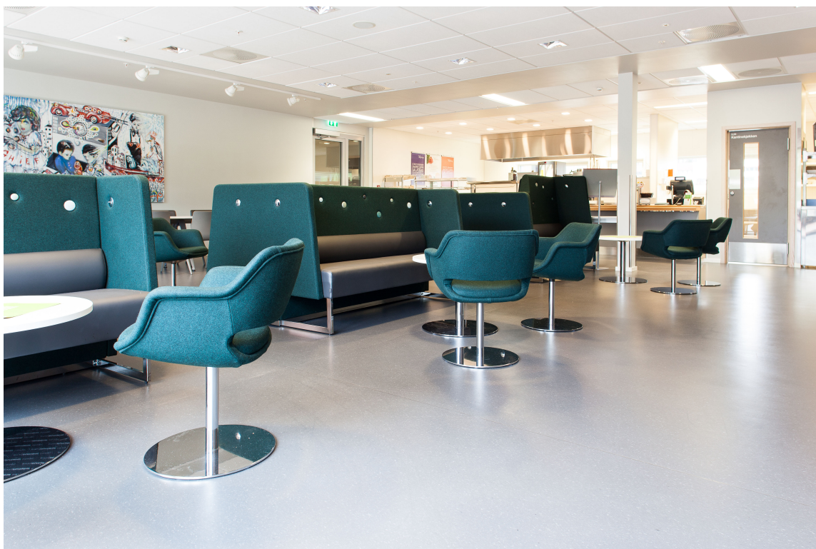
Den romslige kantinen er dekorert med et absolutt relevant kunstnerisk innslag.