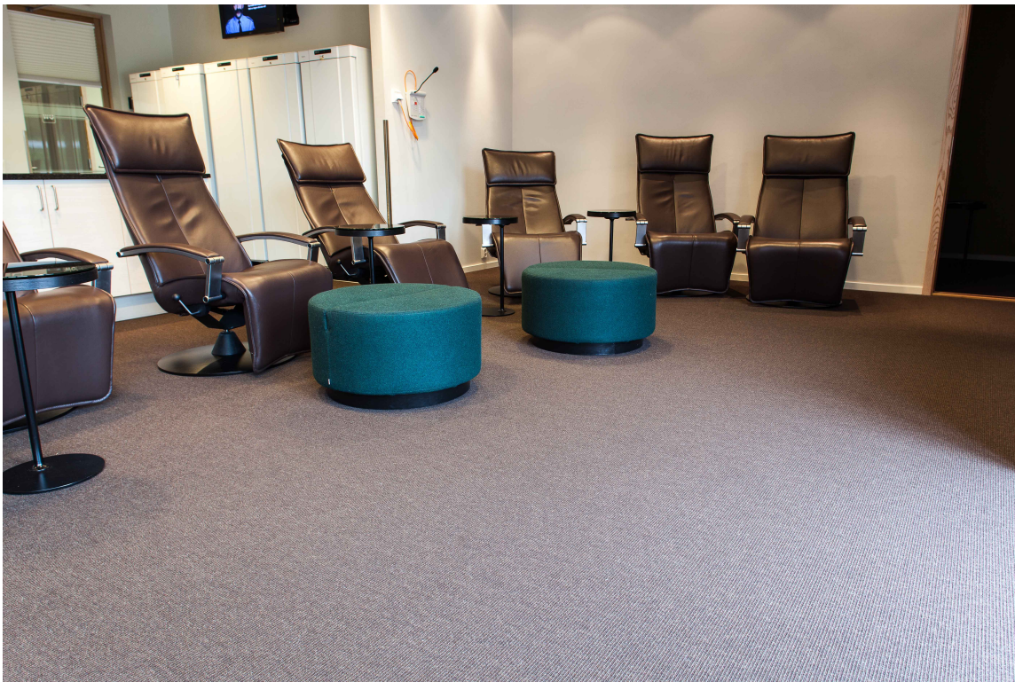
Å være på brannvakt kan innebære en del venting – og da er et trivelig hvilerom godt å ha.