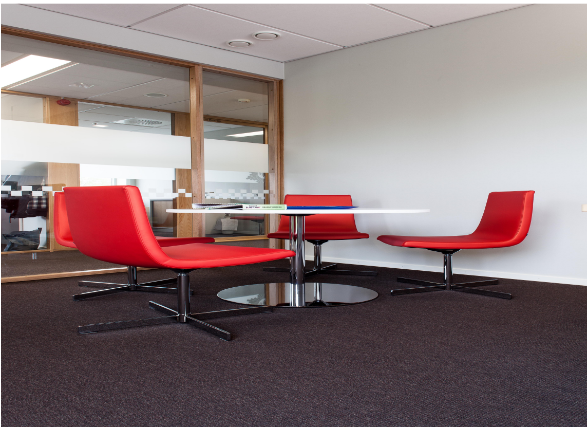
Brannsjefens kontor er naturlig nok innredet med mulighet for mindre møter og samtaler.