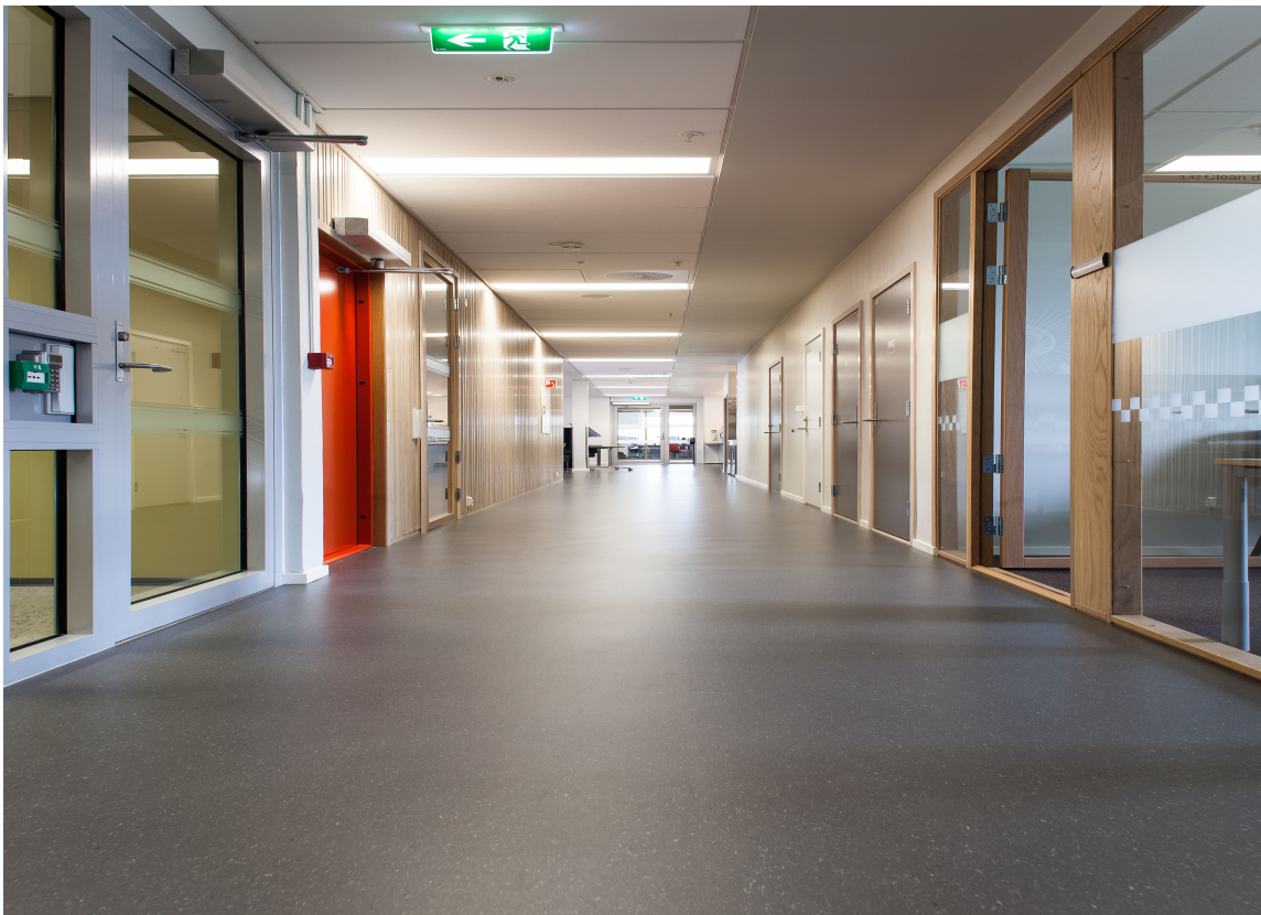
Sluppen brannstasjon er blitt en fargerik opplevelse, og fargene har sin funksjon. Her er det døren ut til «brannmannsstangen» som er tydelig markert i en kontrasterende farge.