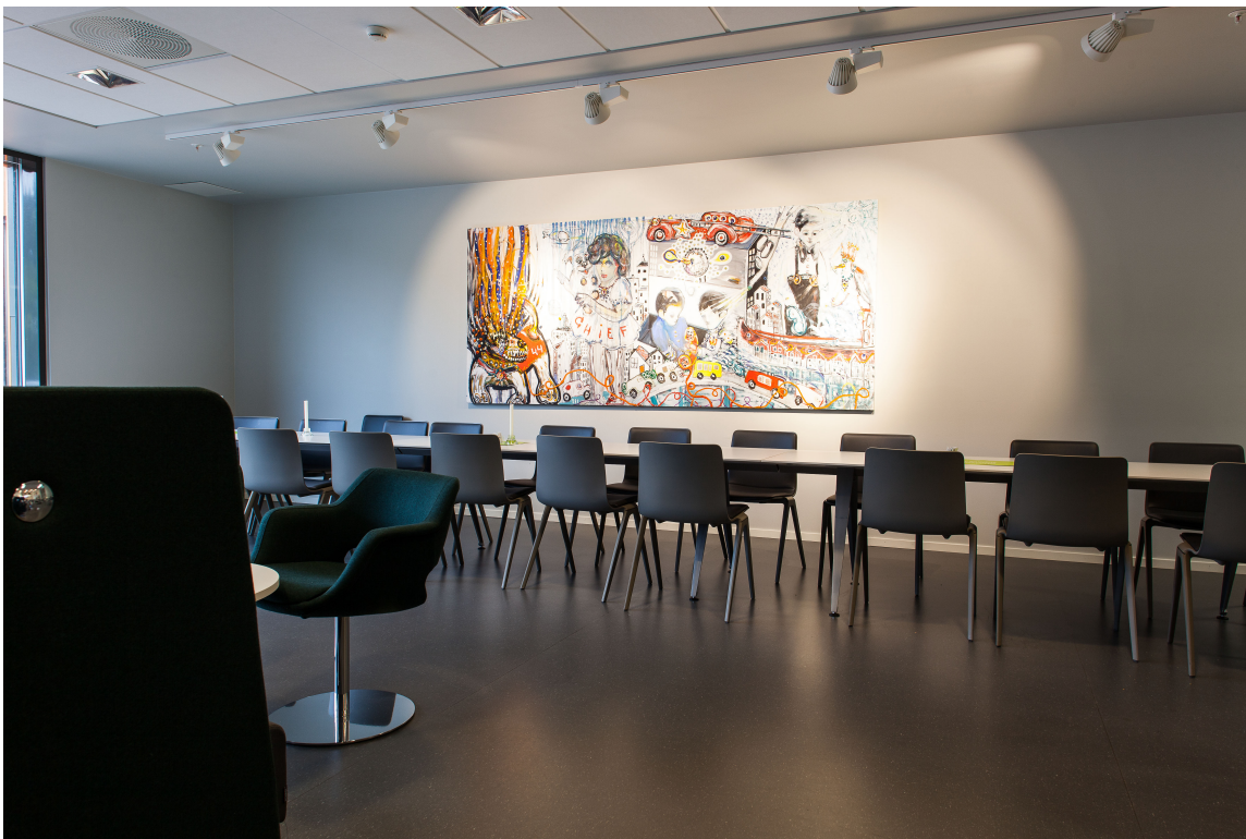
Den romslige kantinen er dekorert med et absolutt relevant kunstnerisk innslag.