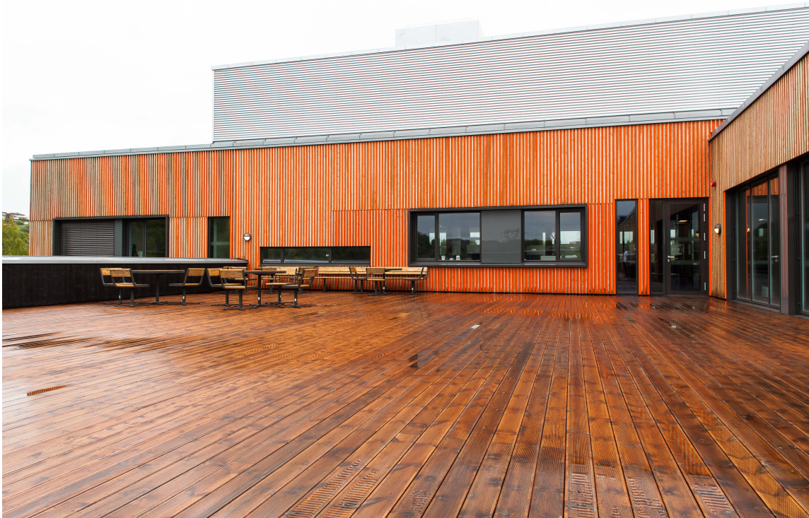
Uterommet er dekorert med malt panel hvor det er montert impregnerte lekter utenpå. Det gir en illusjon av ubehandlet tre, sett fra siden.