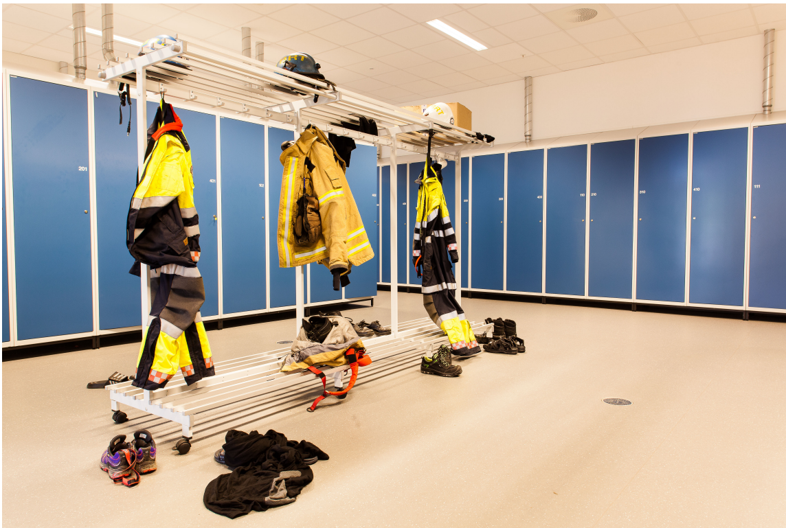
Grovgarderoben er innredet for raskest mulig påkledning av utstyr når alarmen går.