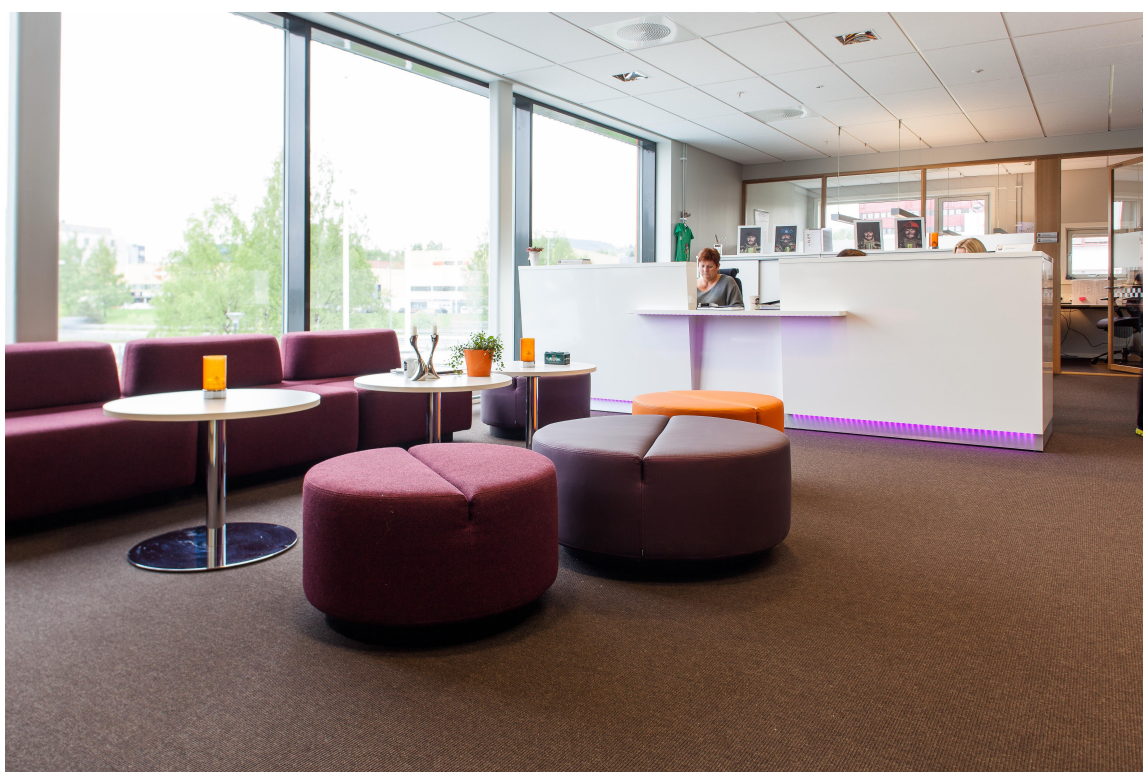
Også resepsjonen i dette bygget har fått sin andel av fargerike elementer, og dagslyset kan ingen klage på.