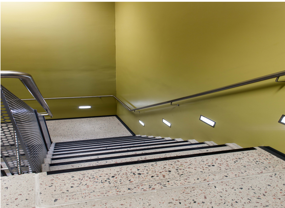
Til malernes store glede fikk de boltre seg med sterke farger, selv i trappehuset.