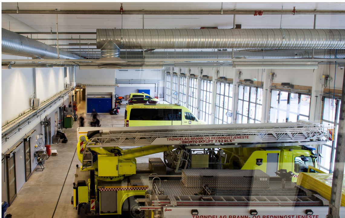
Vognhallen er bygget etter alle kunstens regler for rask utrykning og for vedlikehold av biler og utstyr.