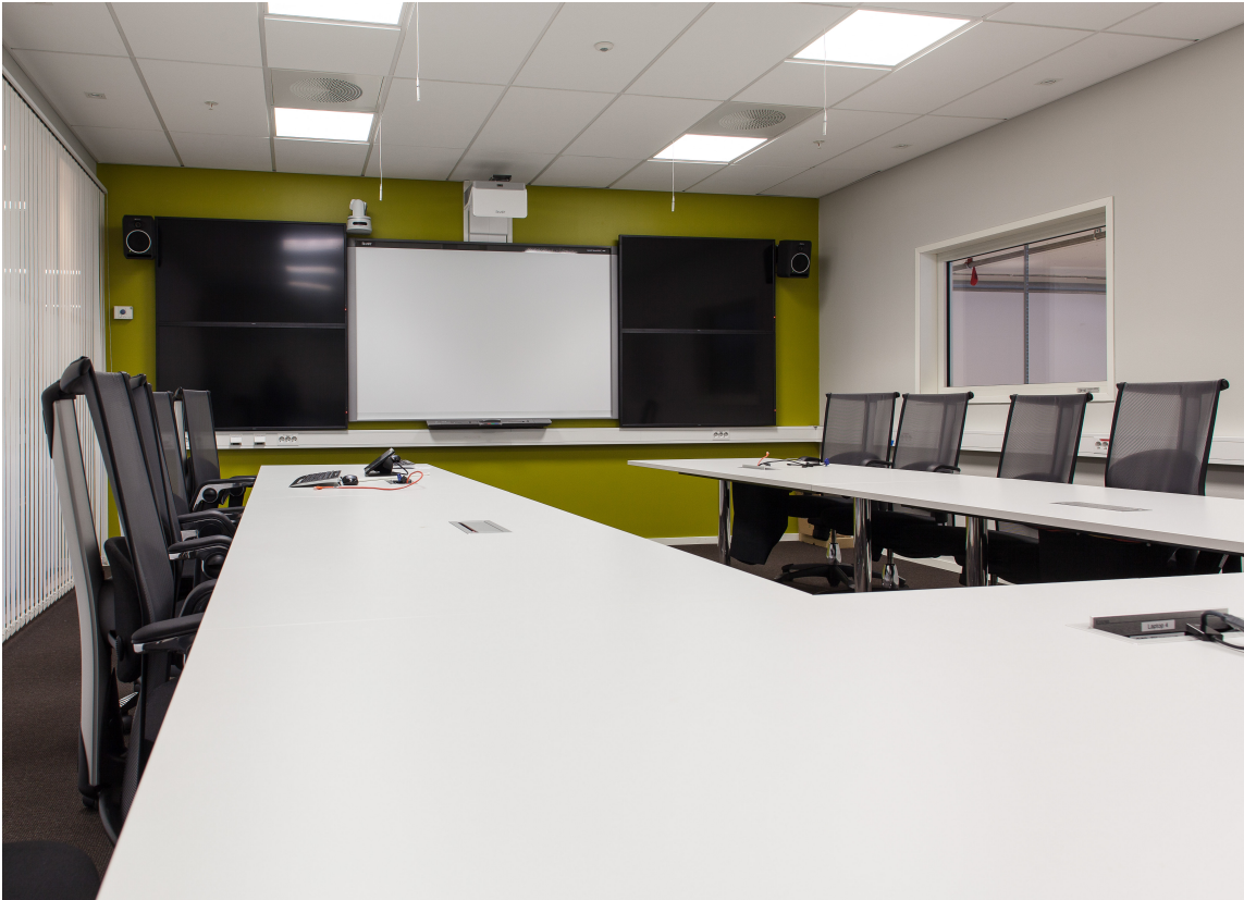
Eget rom for briefing er viktig på en brannstasjon.