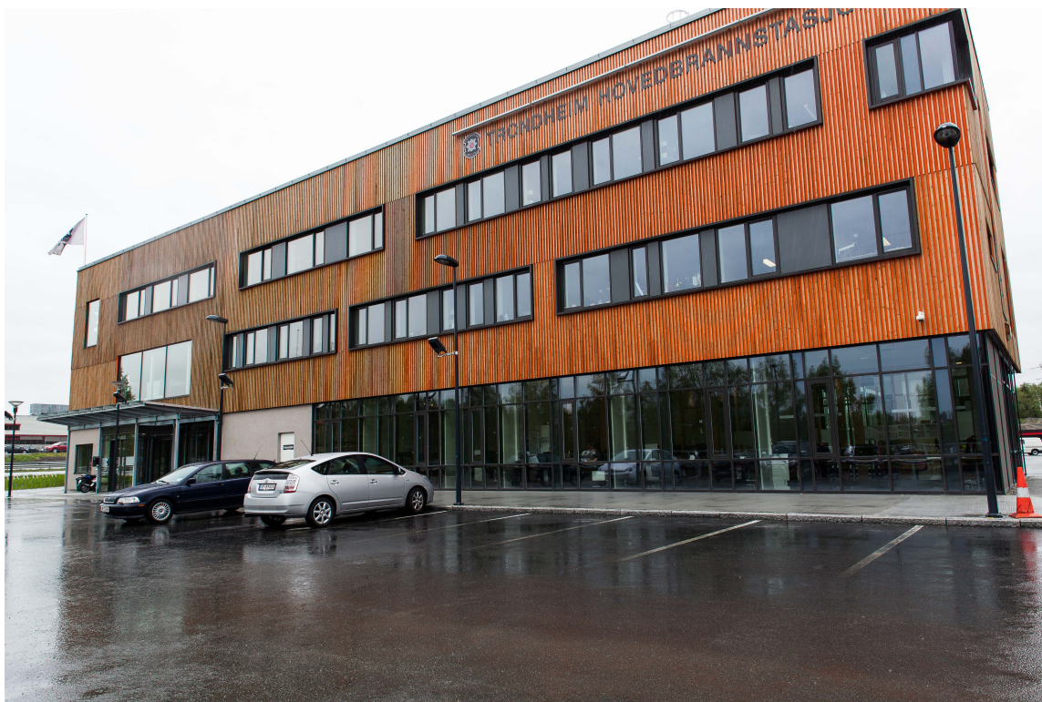
Sluppen brannstasjon i Trondheim.

I de senere årene har det vært et utvidet engasjement for brannetaten i Trondheim; forebyggende virksomhet har fått langt høyere prioritet. Stasjonen på Sluppen har en viktig rolle i innenfor dette arbeidet og driver nå en langt mer publikumsrettet virksomhet. Allerede i vestibylen møtes vi av en utstilling med veteranbrannbil og informasjon om brannvesenets virksomhet.