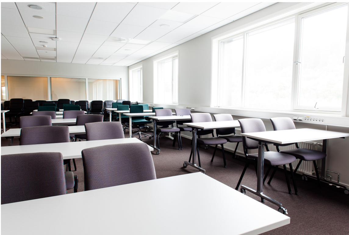
Større møterom kan være nødvendig nå hele staben skal orienteres samtidig – eller om stasjonen får besøk av en skoleklasse.