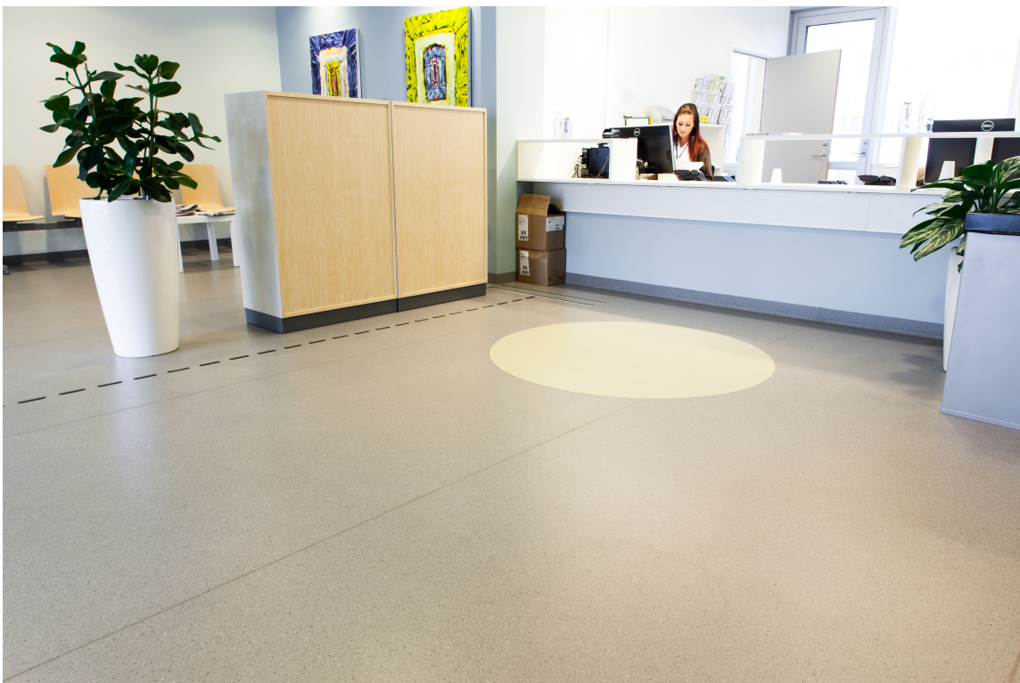
En lys og trivelig resepsjon møter deg når du ankommer senteret.