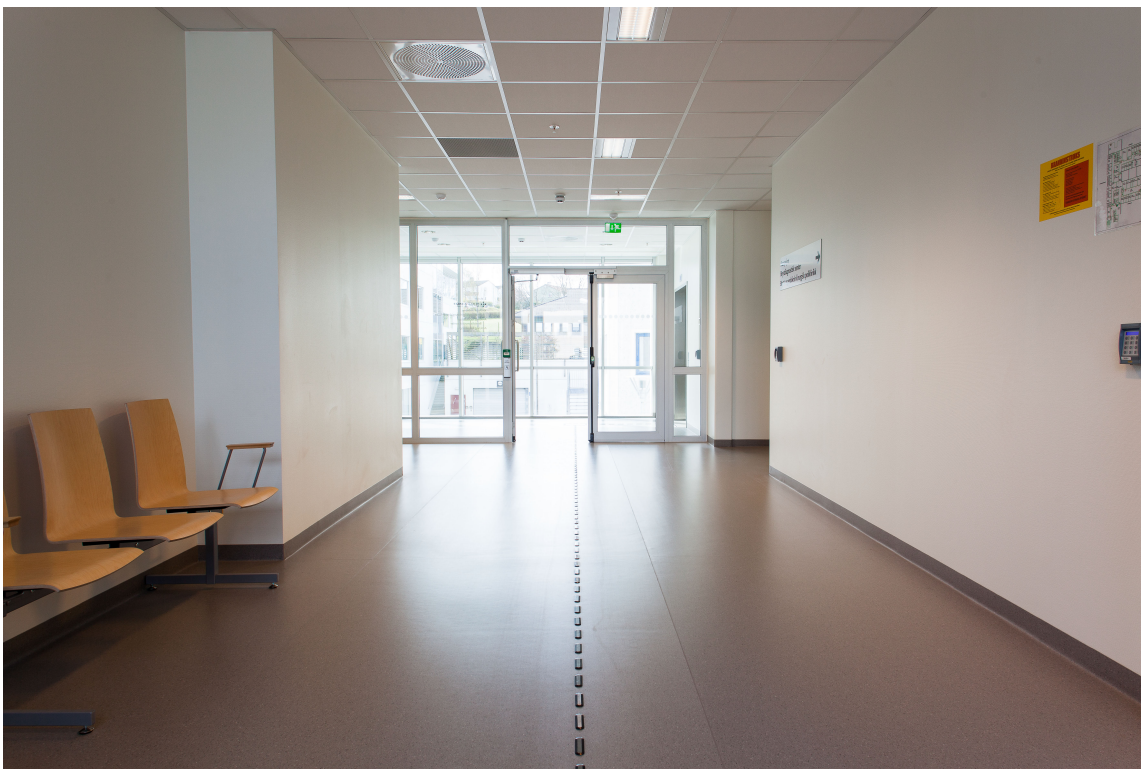
Gulvbelegget er valgt med tanke på lang levetid. I følge renholdssjefen er bare å kjøre over det med renholdsmaskinen for at det skal holde seg skinnende rent og blankt i flere år.