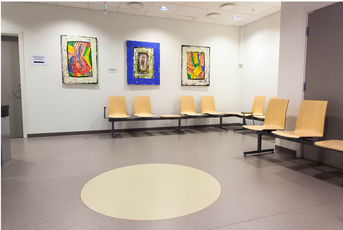
Over hele senteret brytes gulvflatene, som er i diskrete farger og mønstre, av store plasstilskårne sirkler i matchende farger. Veggene er for øvrig dekorert med bilder av en av byens største nålevende kunstnere.