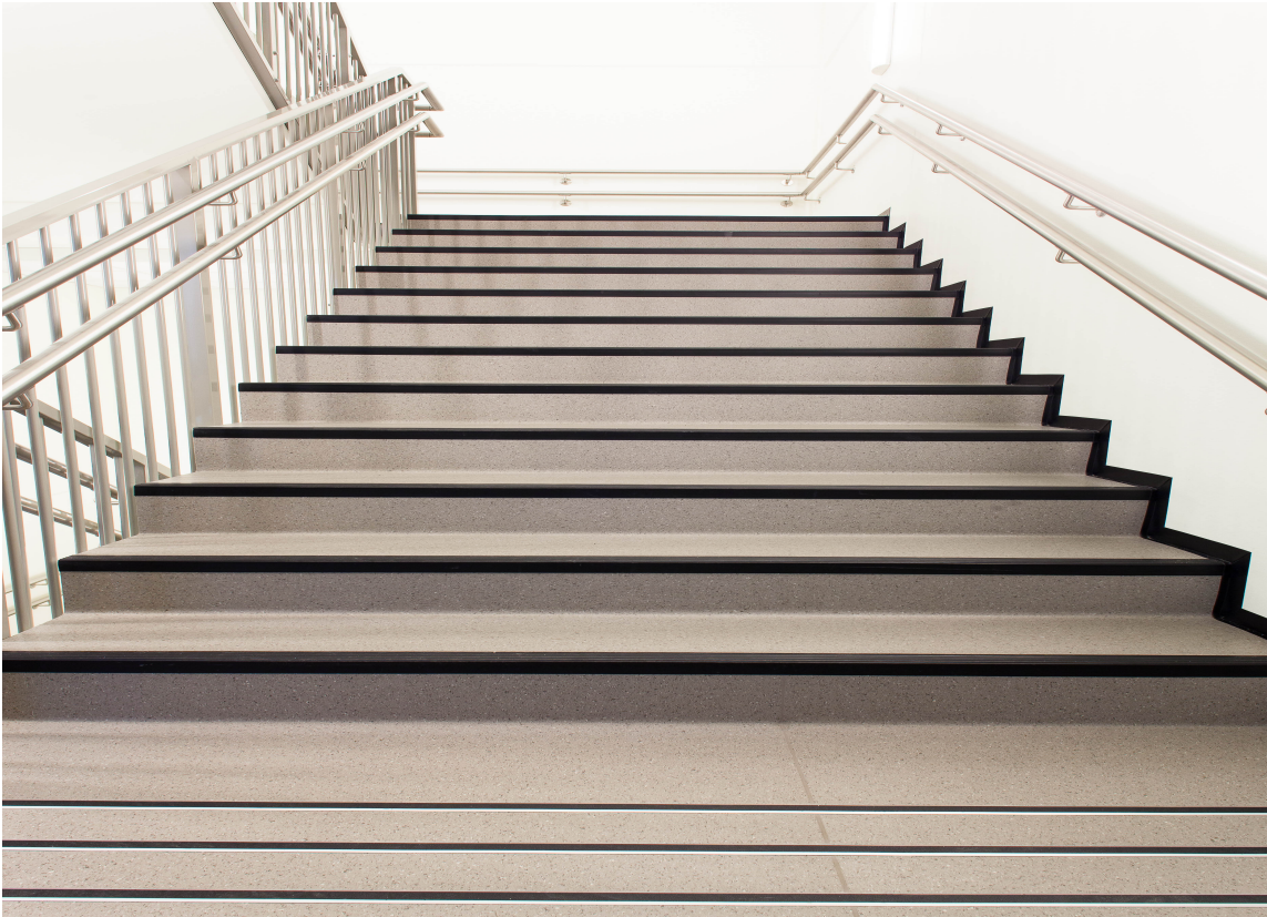
Universell utforming krever også gjennomgående bruk av kontrastfelt og markeringer i trapper.