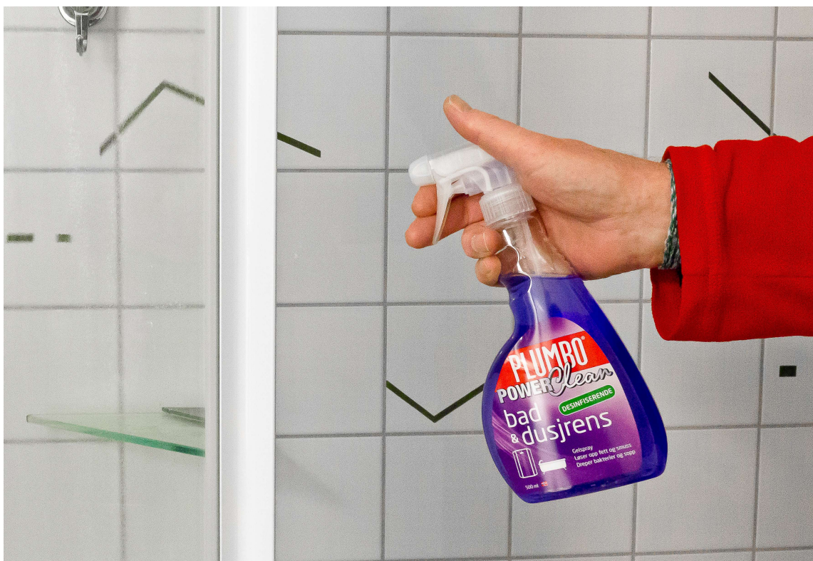
Plumbo Rengjøring Bad & Dusjrens inneholder desinfiserende midler som dreper bakterier og hindrer soppdannelser.