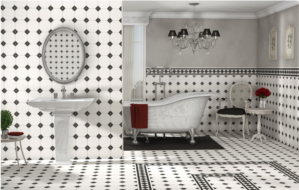
Gulvet på badet holdes rent med fortrinnsvis tørre metoder.