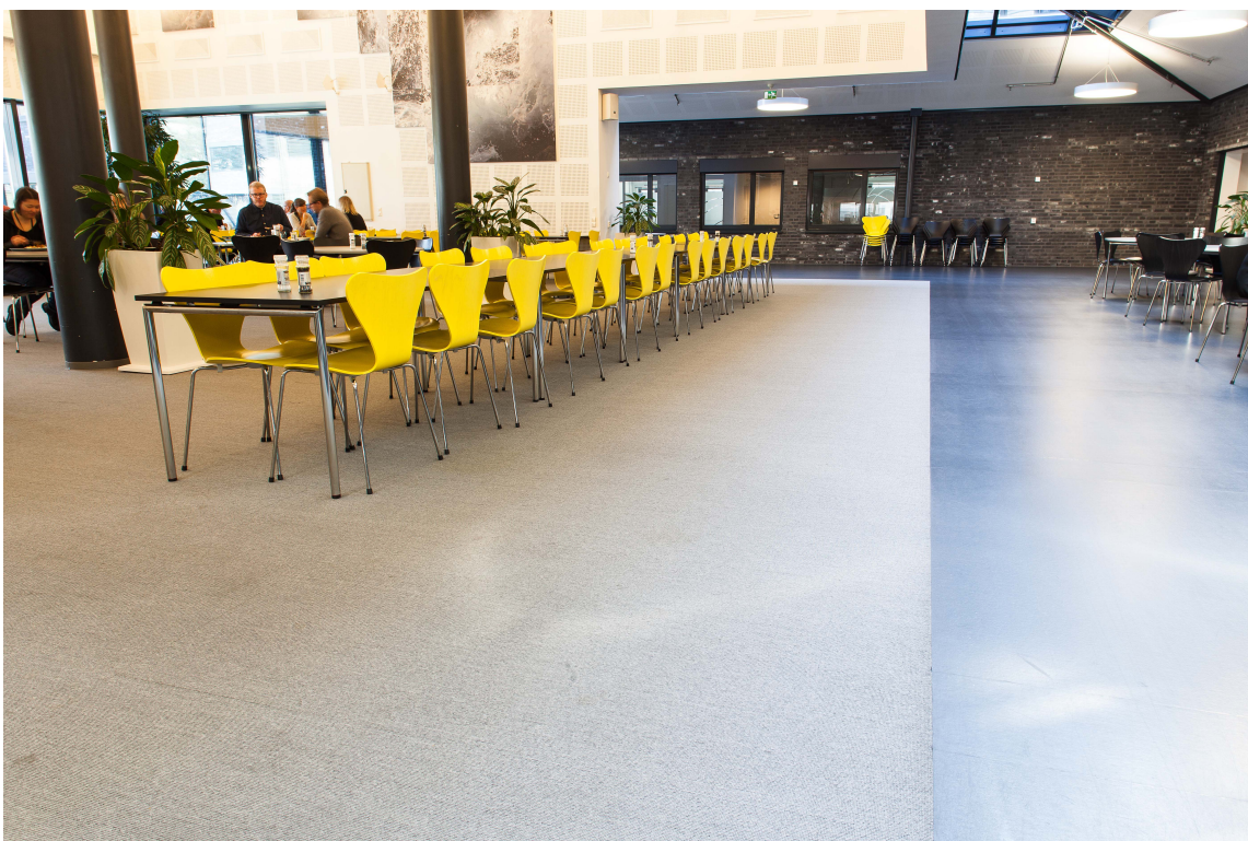
Et tilsynelatende grått og enkelt kanineareal er blitt en fargerik opplevelse, kun ved å velge en frisk gulfarge på stablestolene. Teppefliser gir også langt bedre akustiske forhold.