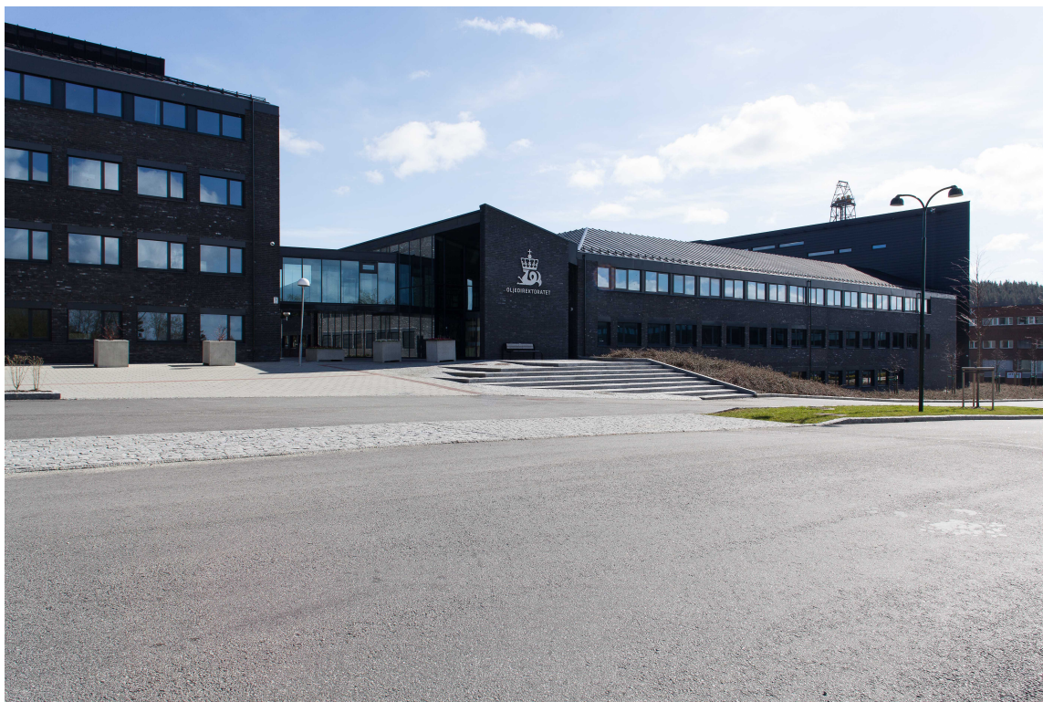
Oljedirektoratets administrasjonsbygg huser 220 ansatte.