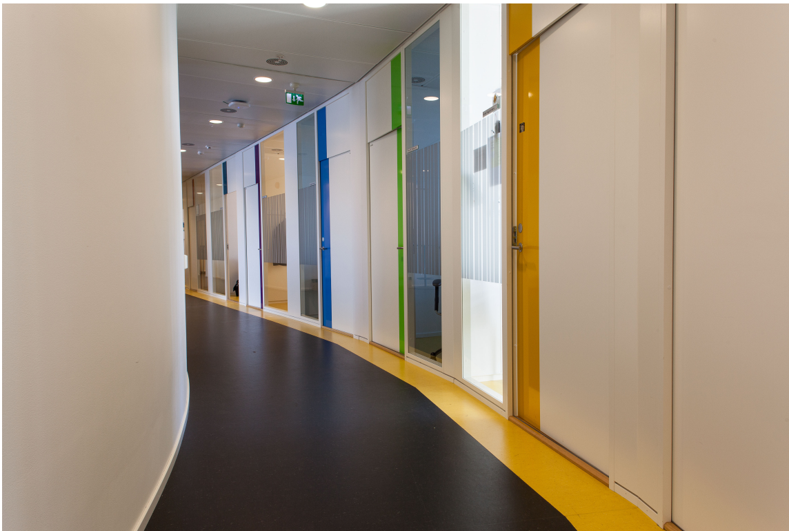
I hele bygget er det gjennomgående benyttet varierende farger som symboliserer de ulike geologiske periodene som vår klode har gjennomgått. Det er også lagt vekt på å skape en spennende gulvflate ved å bryte opp det mørke linoleumsgulvet med gult.