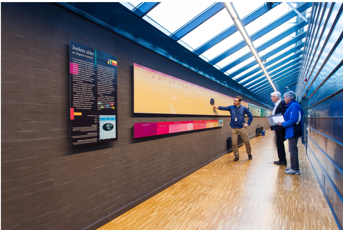
En finner også veggdekorasjoner med betydelig nytteverdi. Her er en illustrasjon av jordas geologiske historie. Når alle perioder skal vises i riktig forhold til hverandre, trengs en plansje på 70 meter.