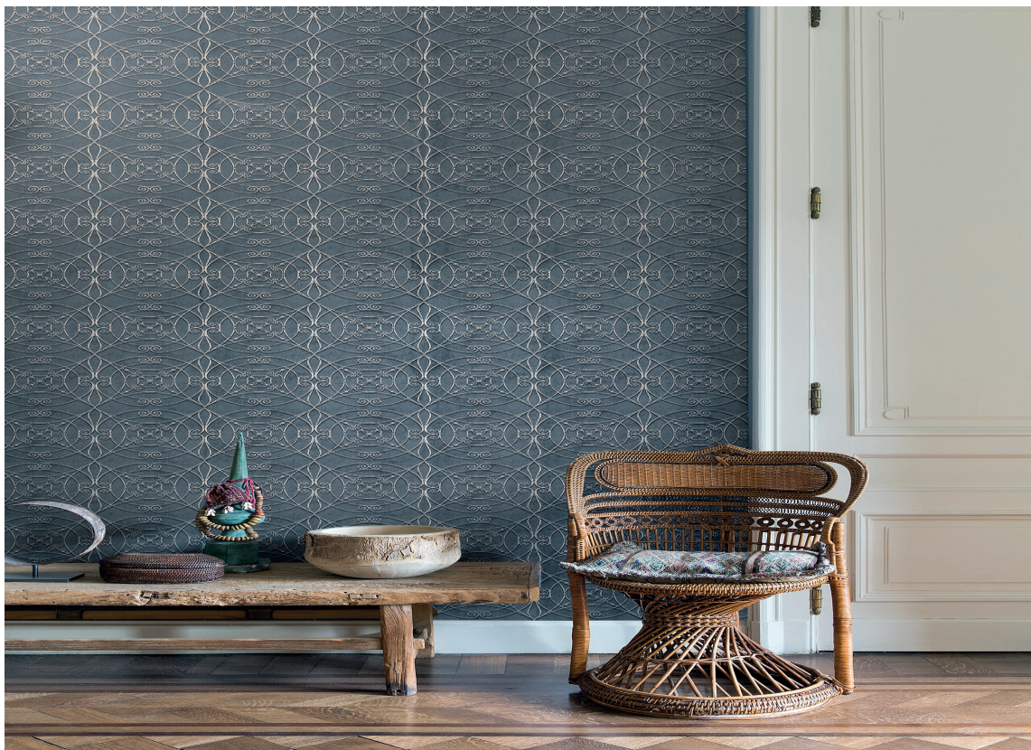
Murveggstapet og marokkanske mønstre setter sitt preg på kolleksjonen Tuscany.