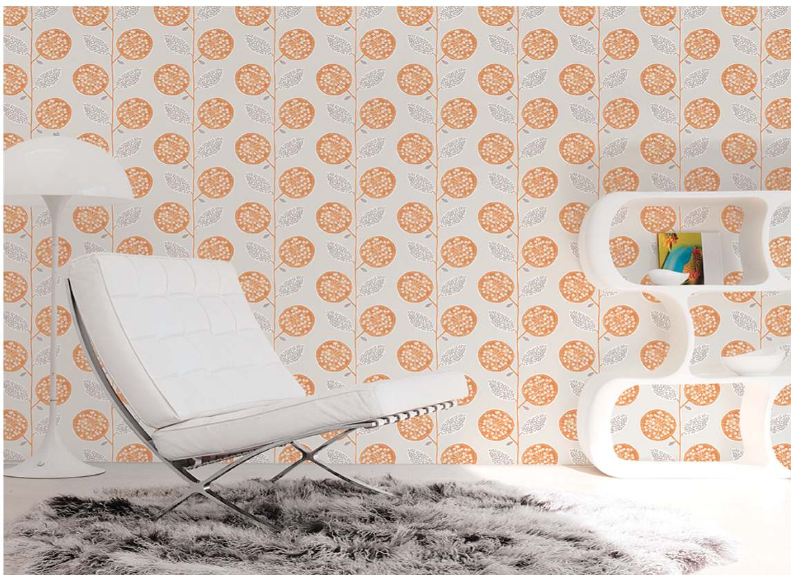
Tempo er en kolleksjon med design innenfor kategorien moderne retro.