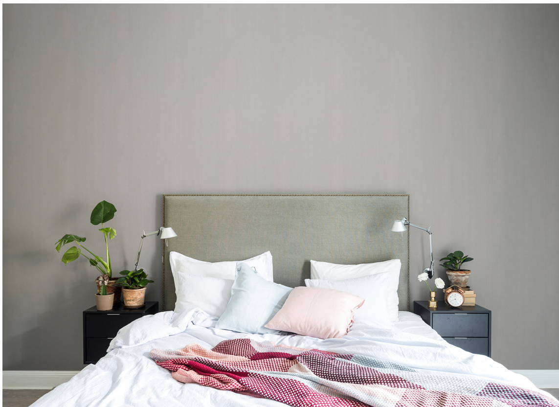
Tweedmønstre gir dybde og liv til tilnærmet ensfargede vegger.