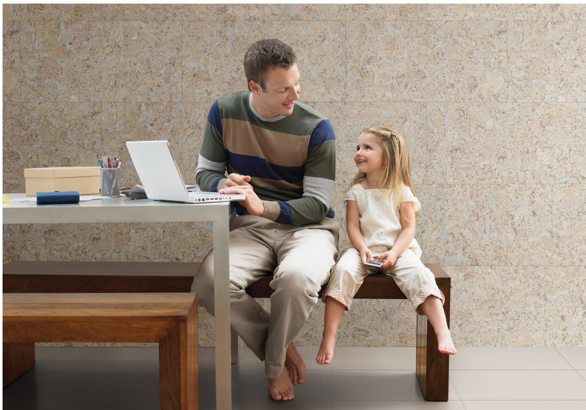
På veggen blir kork et blikkfang, som bidrar til god akustikk i rommet.