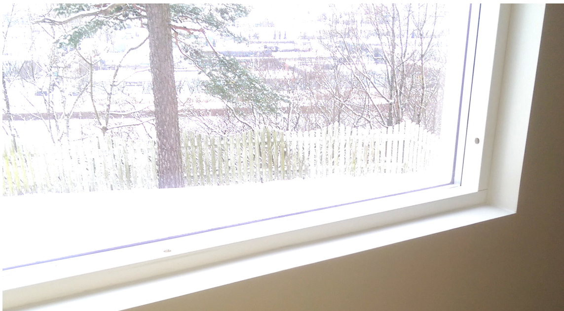
Overgangene mellom veggplater og vinkellisten er helt usynlige etter vanlig sparkling.