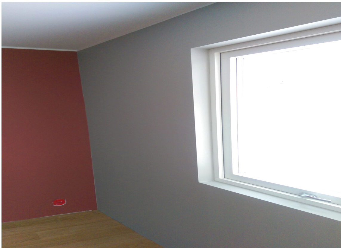
Listefrie vinduer gir et moderne inntrykk.