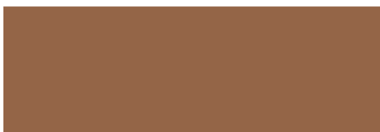
Mahogny, oljet NCS S 5030-Y70R

NCS: Fargene på tresortene er dokumentert ved å finne NCS-kodene som er tilnærmet lik treprøver av nytt virke. Det er ikke her tatt hensyn til aldring og patina.