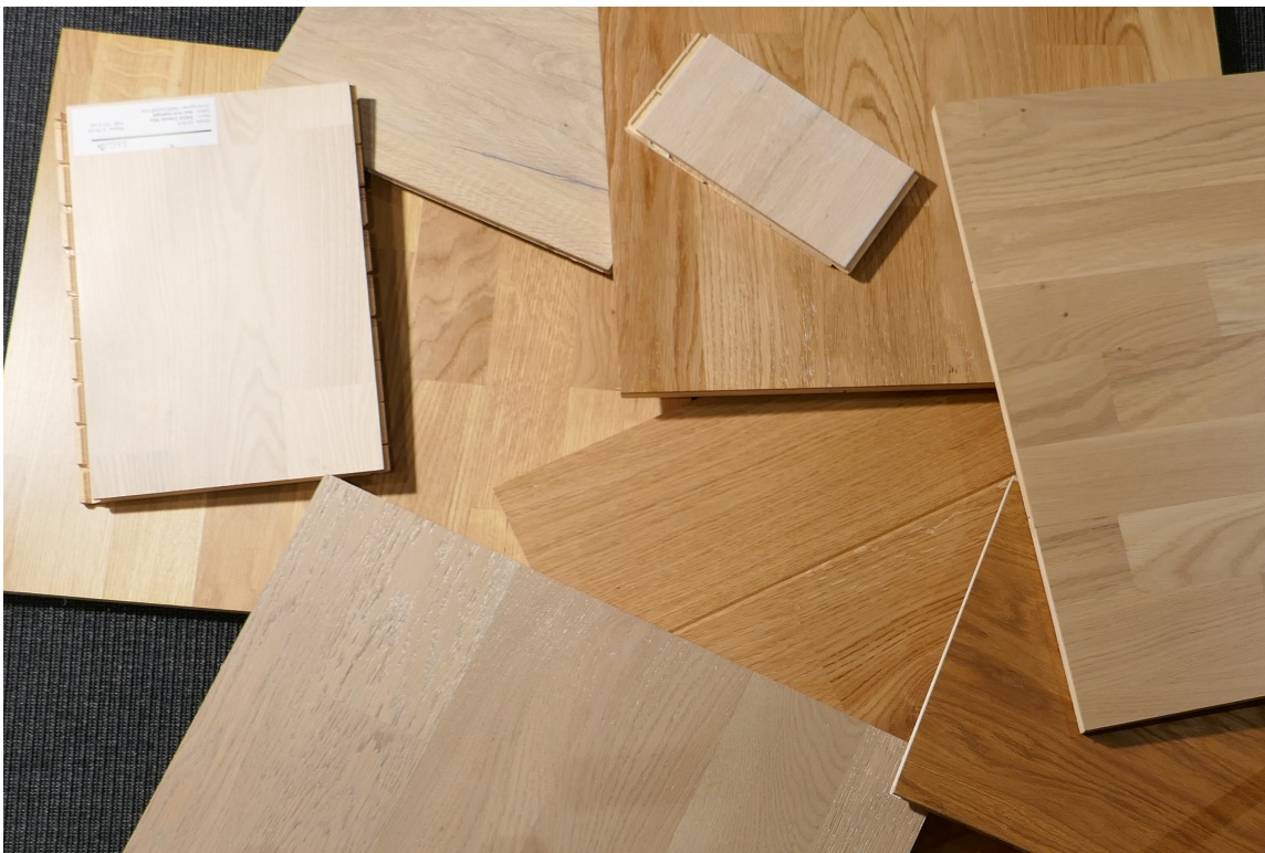
FARGESPILL: Hvert treslag har sin farge og mønstring som gir treet særpreg, og med ulike behandlinger er det et mangfold av farger som vi må ta hensyn til når vi fargesetter rommet.