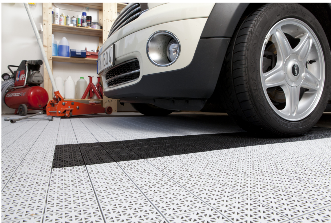
Lag ditt eget mønster med fliser i ulike farger.