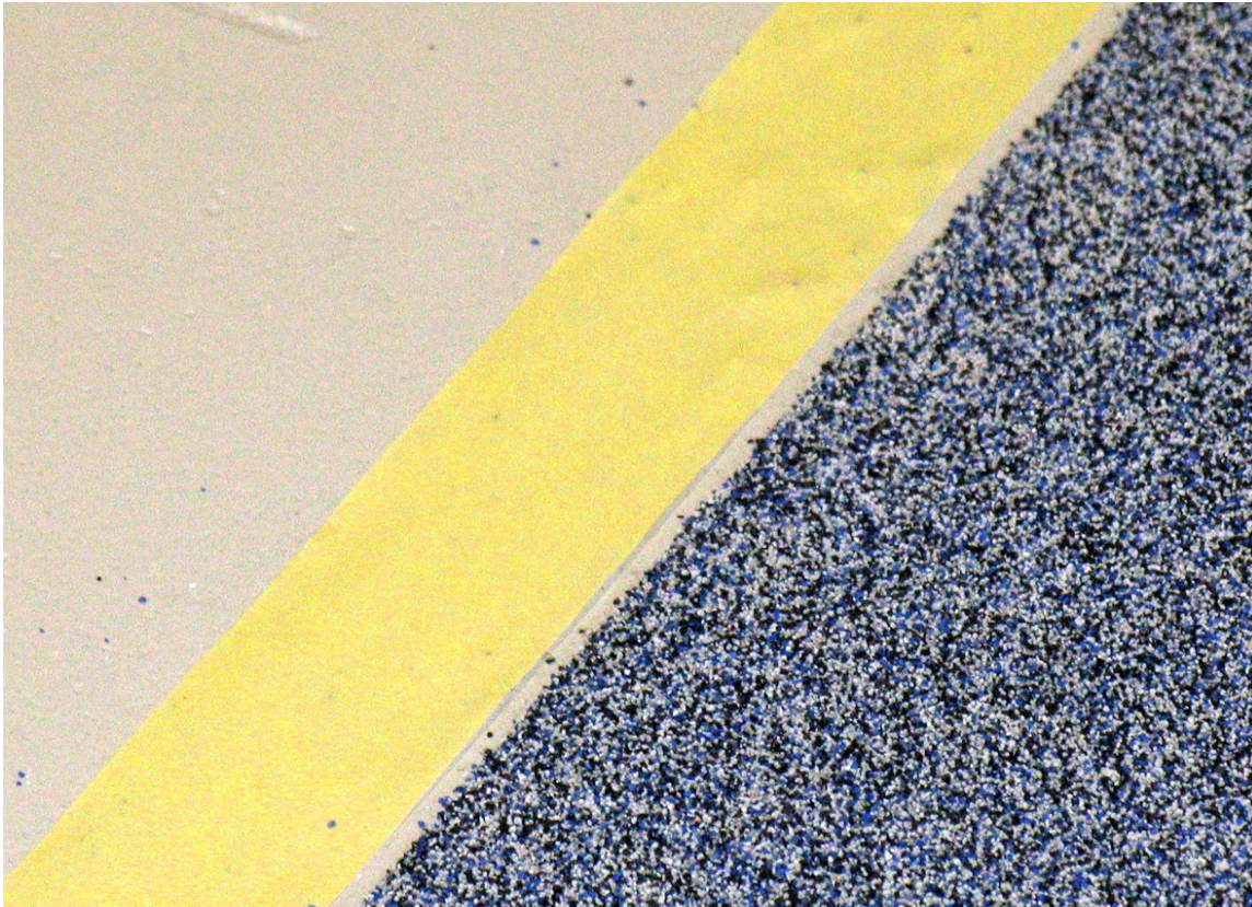
Sand drysses i den våte lakken.