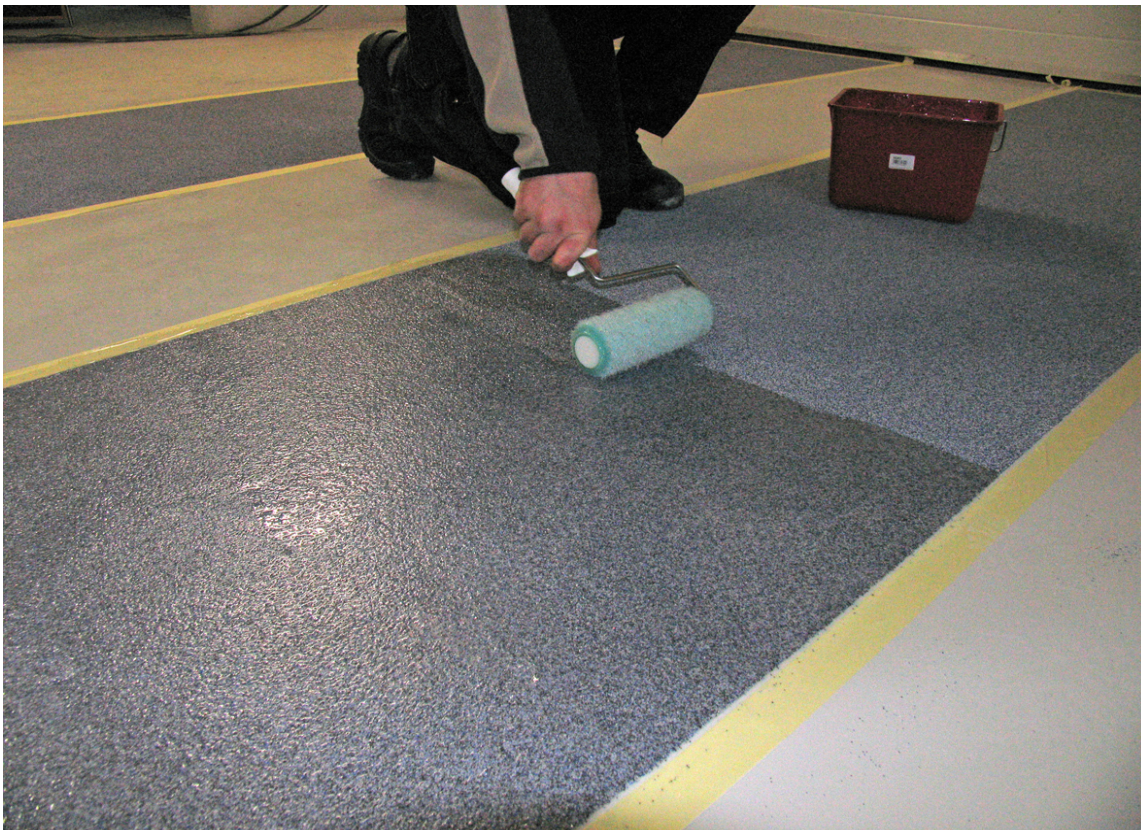
Et toppstrøk med tyktflytende gulvlakk påføres til slutt.