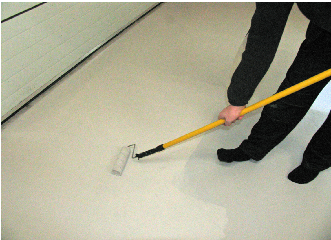
To-komponent gulvmaling rulles på gulvet - minst to strøk.