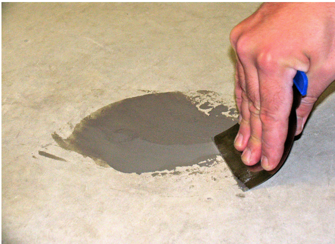
Sår og hakk utbedres med egnet sparkelmasse.