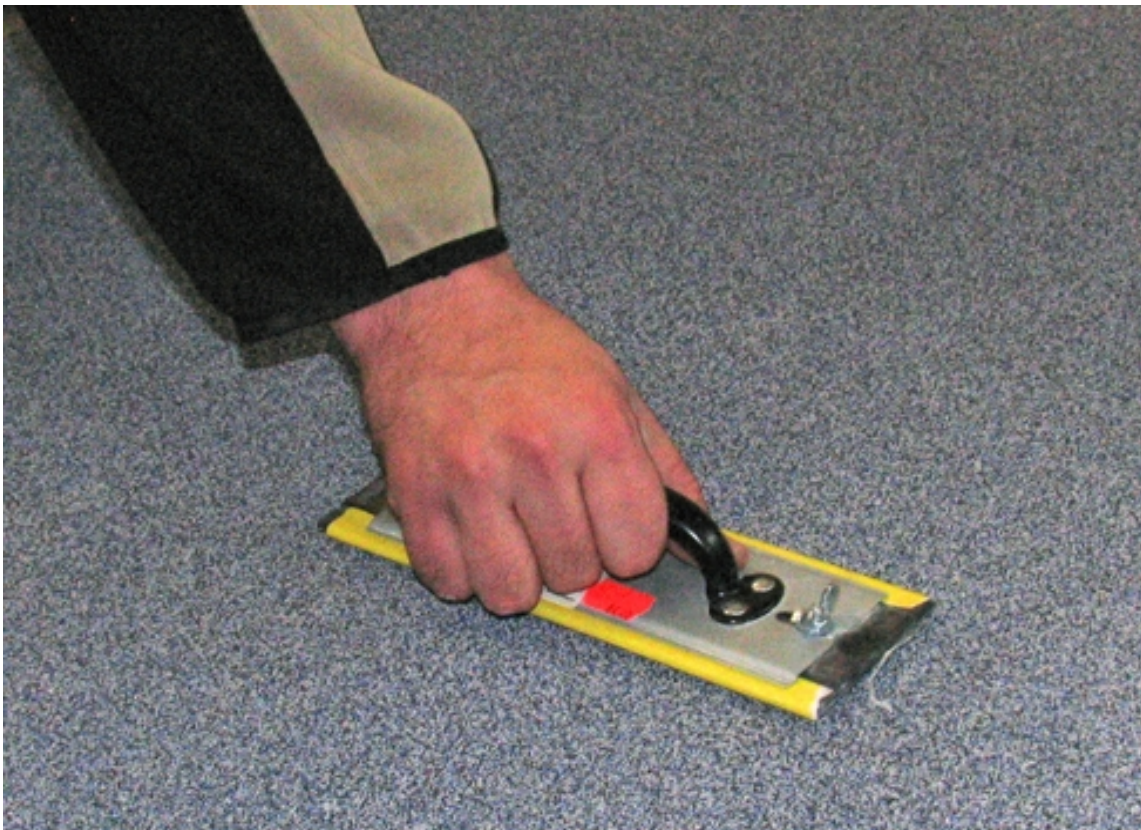
Overflødig, løs sand fjernes.