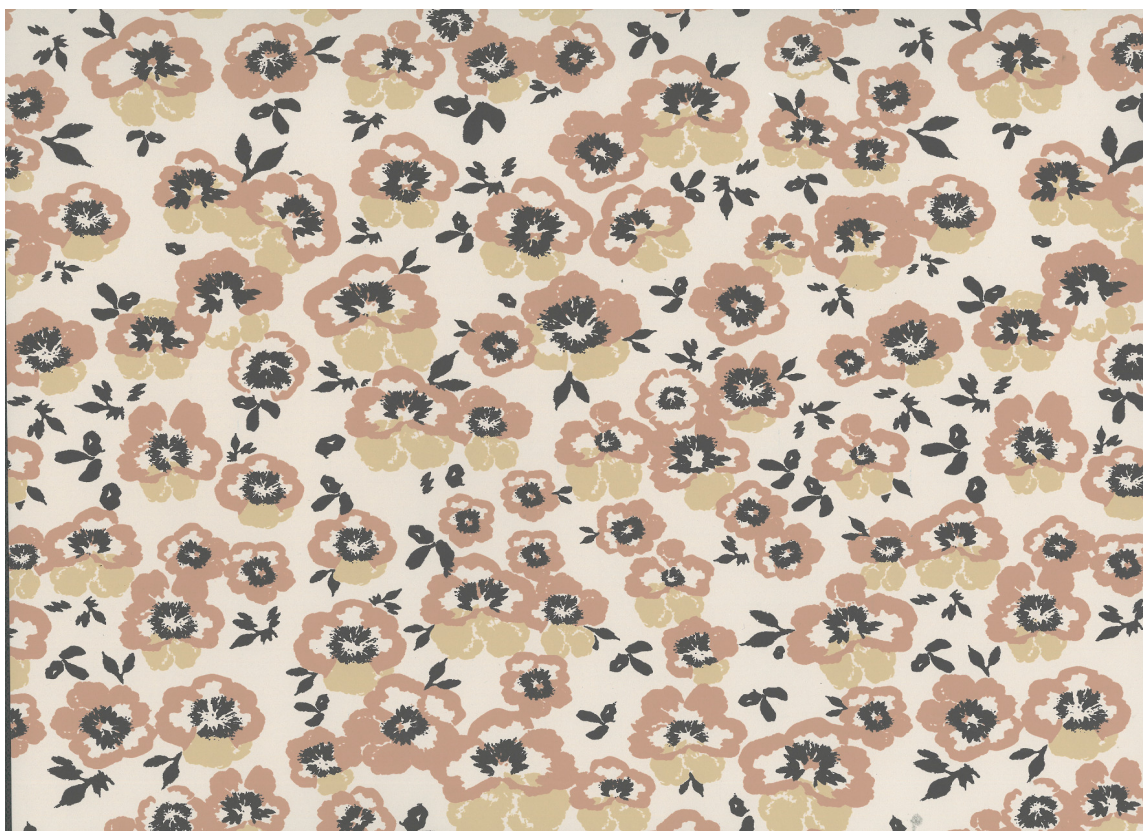
Stemorsblomsten er en av de tidligste og vakreste sommerblomstene. Motivet er romantisk og feminint, og passer bra i rommet både til liten og stor. Tapetet er fra Botanic Garden av Flügger.