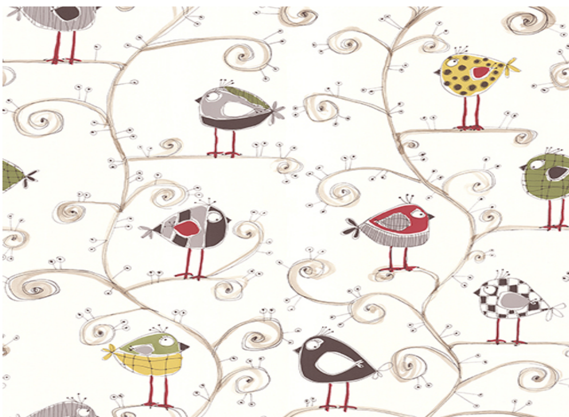
Fantasifulle fugler i fine farger for alle med humoren og barnesinnet i behold! Fra Fantasi Interiørs kolleksjon Nature.