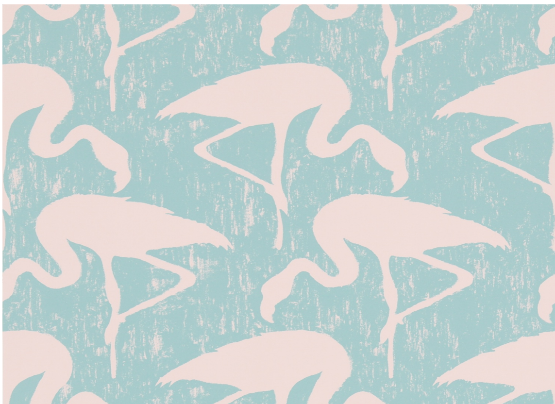
Hvem vil ikke ha en rosa flamingo? Dette vakre og morsomme tapet blir en prydd for enhver vegg! Tapetet er fra Sanderson/Intag.