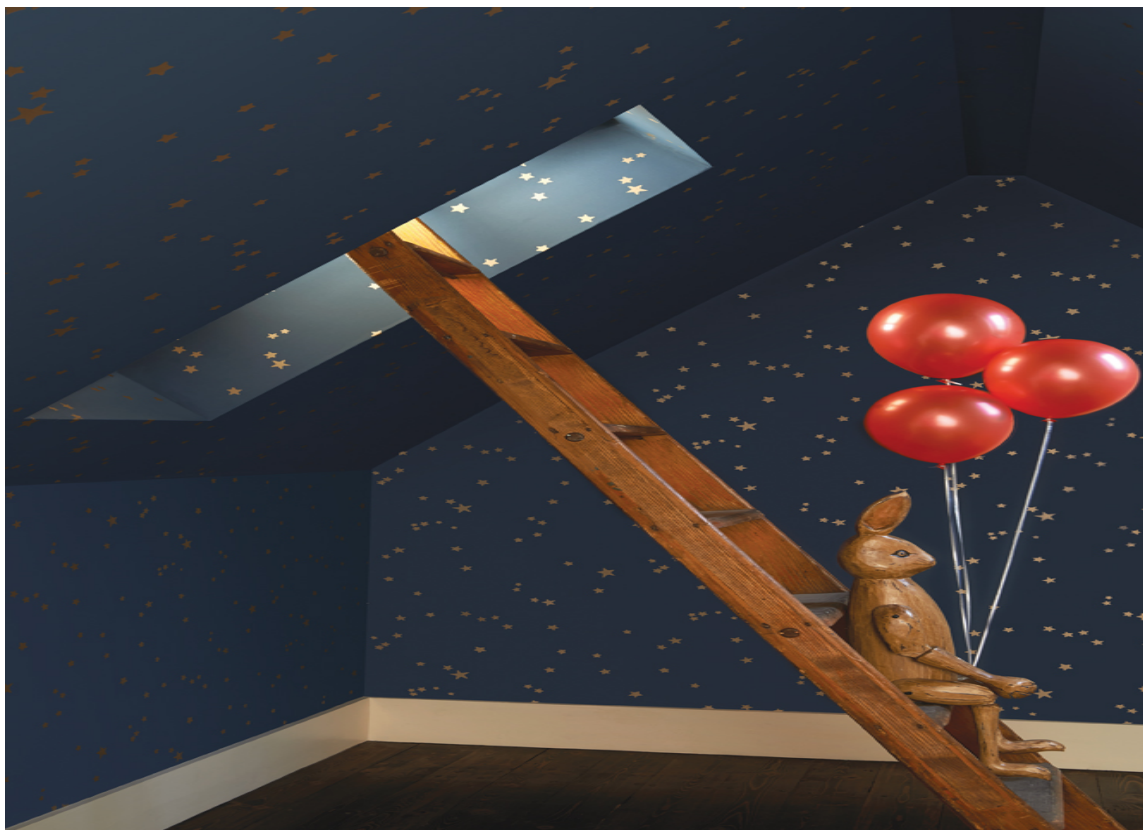
Å sove under stjernehimmelen er å sove godt! Barnets fantasi tegner figurer og finner opp historier blant stjernekonstellasjonene på vegger og tak. Tapet er fra Cole & Son/Borges kolleksjon Whimsical.