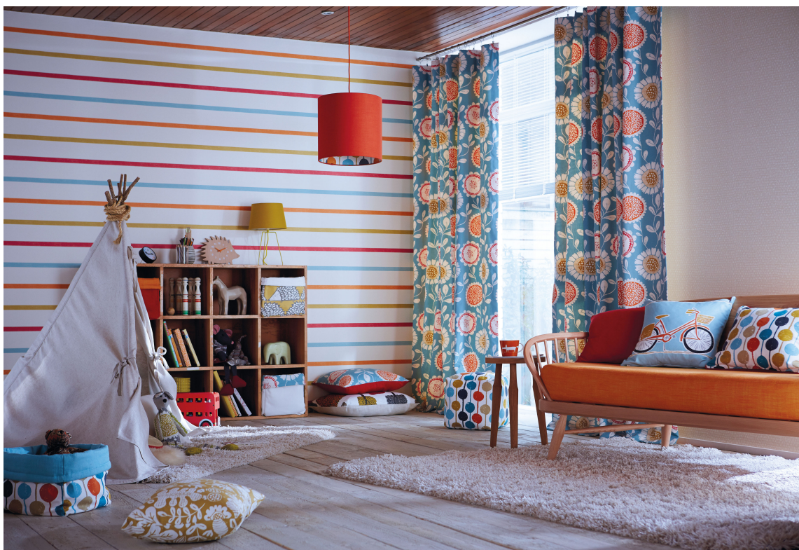
Striper går aldri av moten. Og de kan like godt brukes liggende som stående. Tapetet er fra Harlequins/Tapethusets kolleksjon Levande.