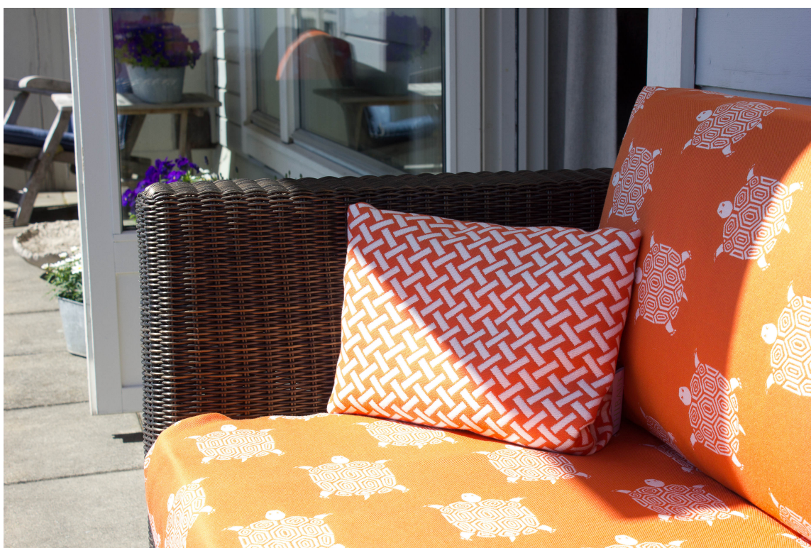
Med noen fargerike tekstiler blir de mørke rottingmøblene straks mer sommerlige.