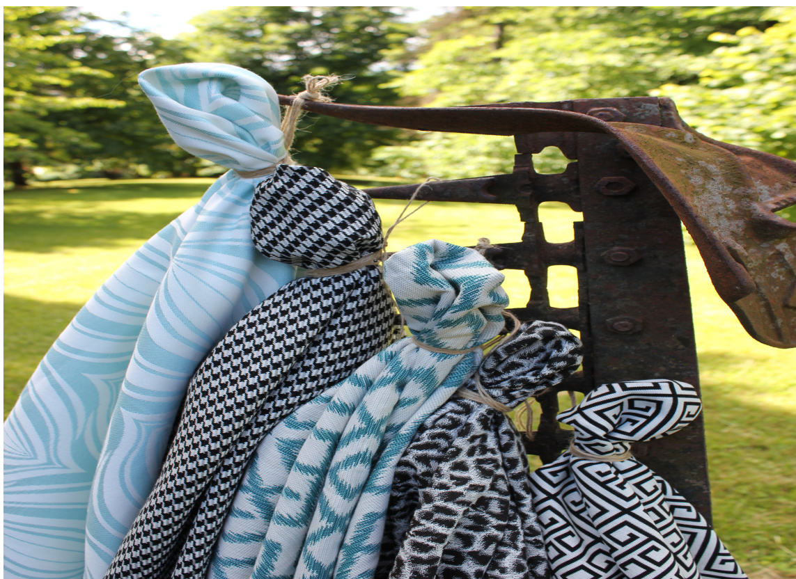
Mønstermiks fungerer fint utendørs. Her er det samlet ulike utendørstekstiler fra Green Apple i ulike mønstre i sorte og blå nyanser.