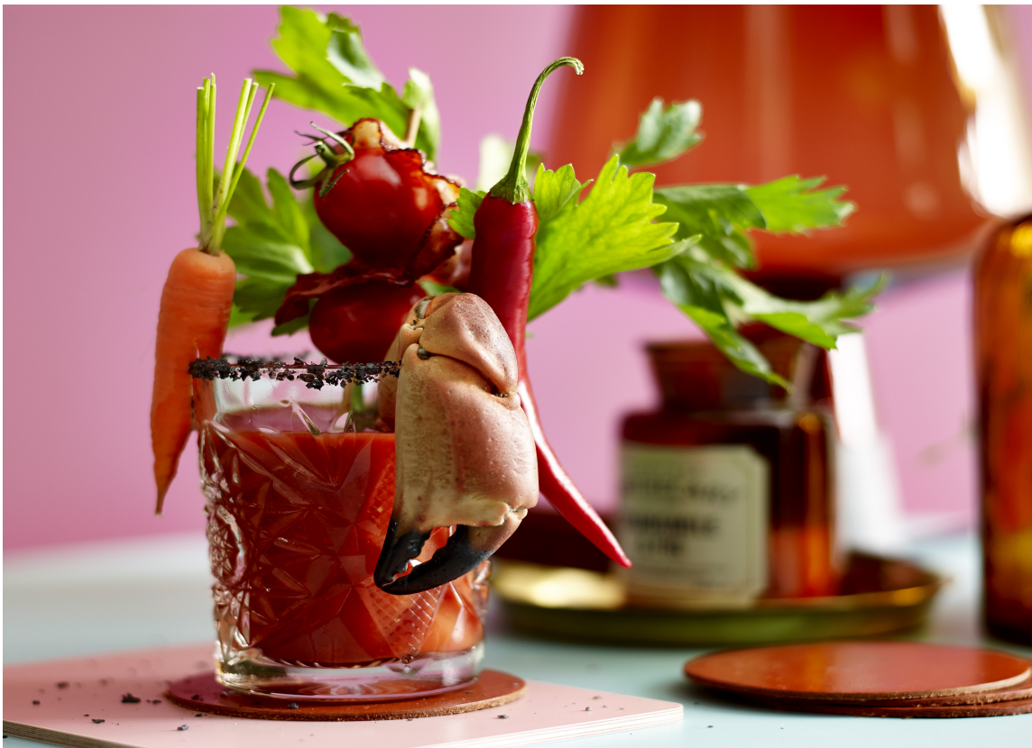
Rødt og grønt er kontrastfarger.