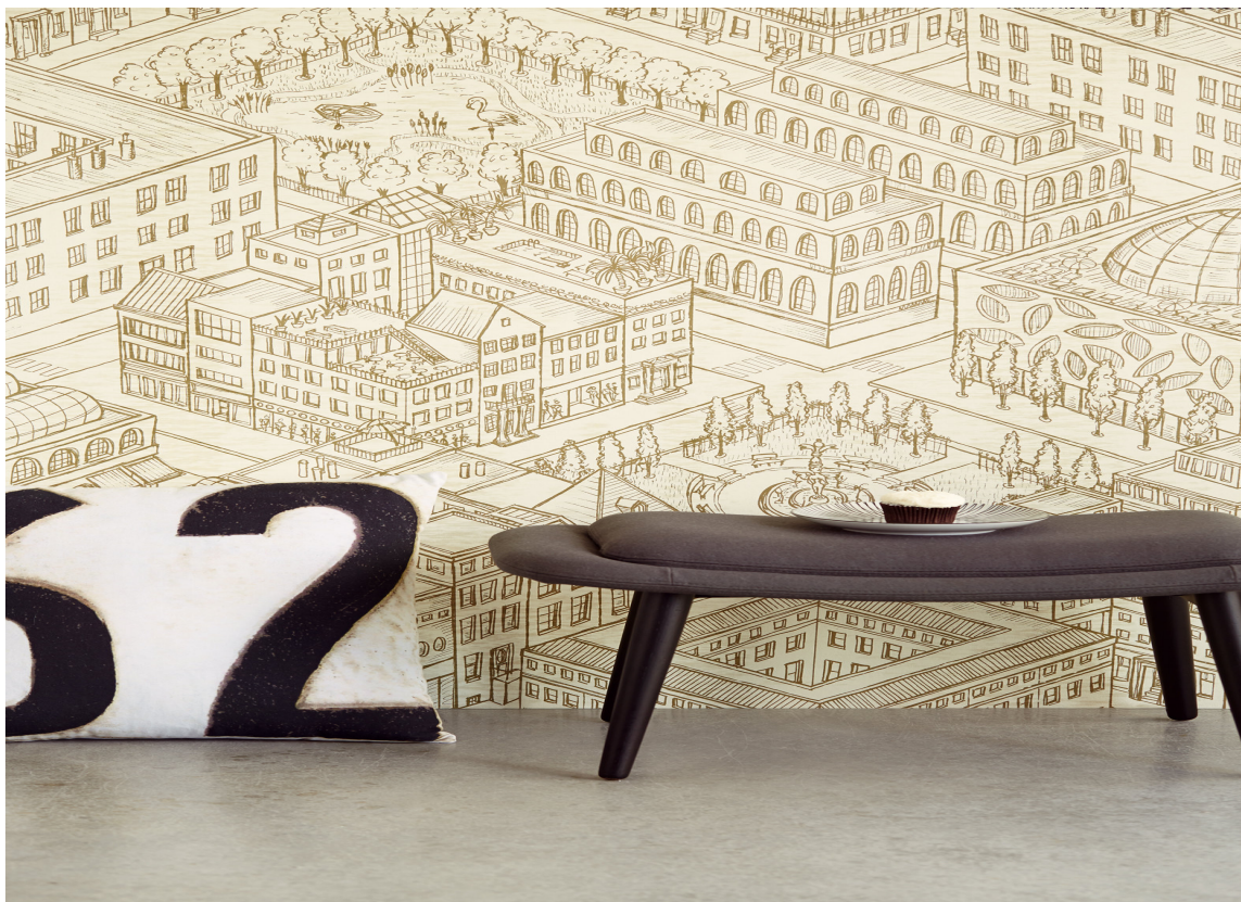
Sett lys i et vindu, gjør et tre grønt og mal en fasade.

– Her kan du sette farge på et enkelt tre, legge lys i et vindu og lage et artig motiv, sier han.