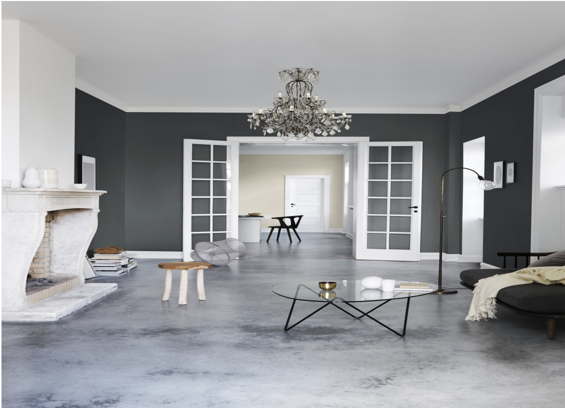
Farger bidrar til å lage et varmt eller et kaldt interiør.