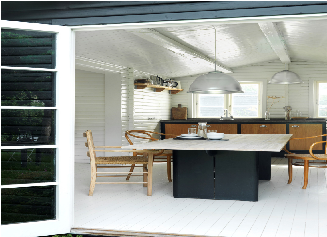
Blande varme trefarger med mørke og lyse farger på vegger, interiør og gulv.