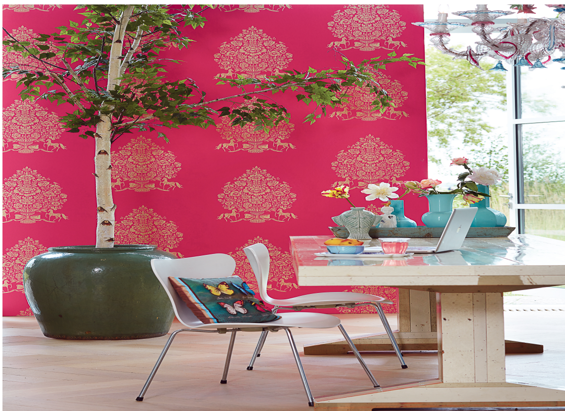
Et friskt tapet fra Eijffinger/Astex for den som elsker cyklamen.