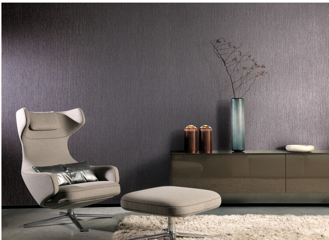
Et alternativ for den som elsker lilla; tapet i en dempet grållilla nyanse. Denne er fra Green Apple.