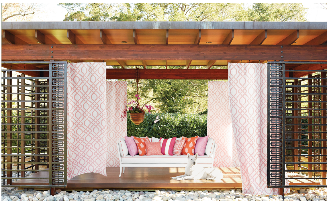
Innslag av oransje passer bestandig, også ute! Her er tekstilene fra Thibaut/Intag.