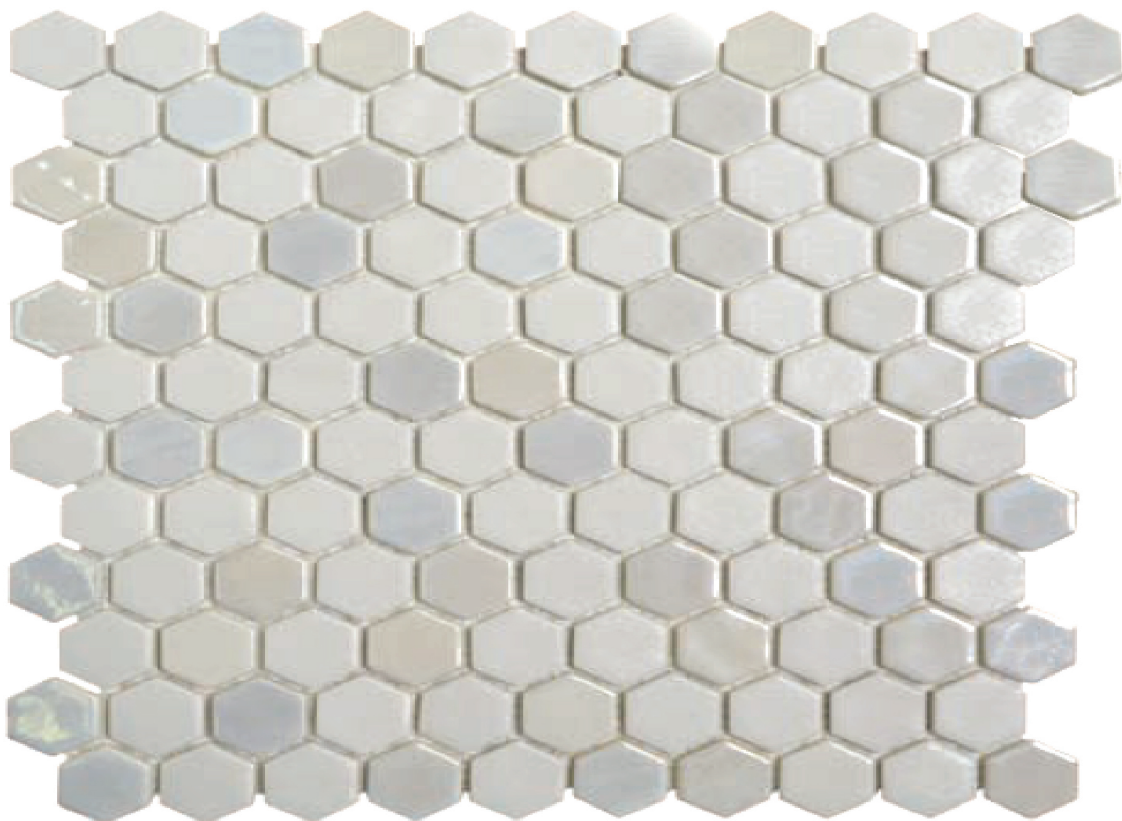
Nyheten Hexagon Collection består av ni ulike design - her á la Carrerra marmor.