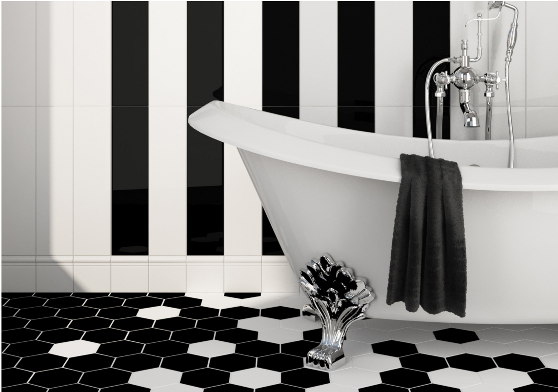
Sorthvitt i grafisk stil, med Extro fra Golvabia.