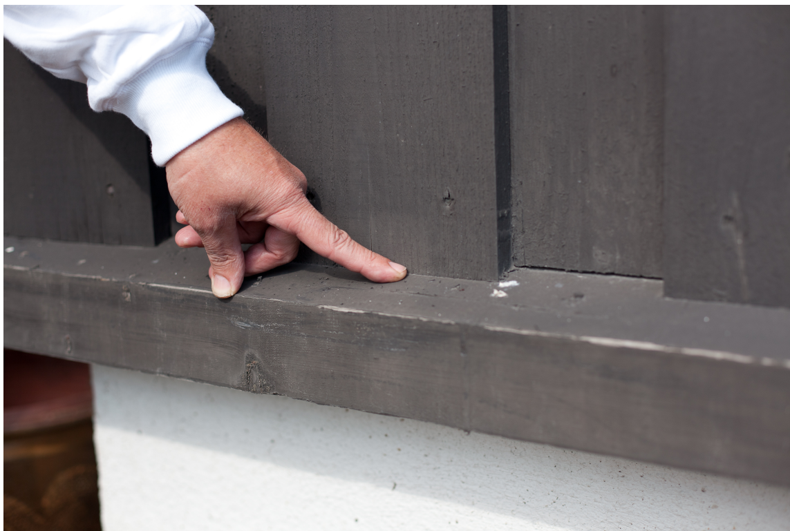
Her står kledningen uten lufting - svært utsatt for råte.