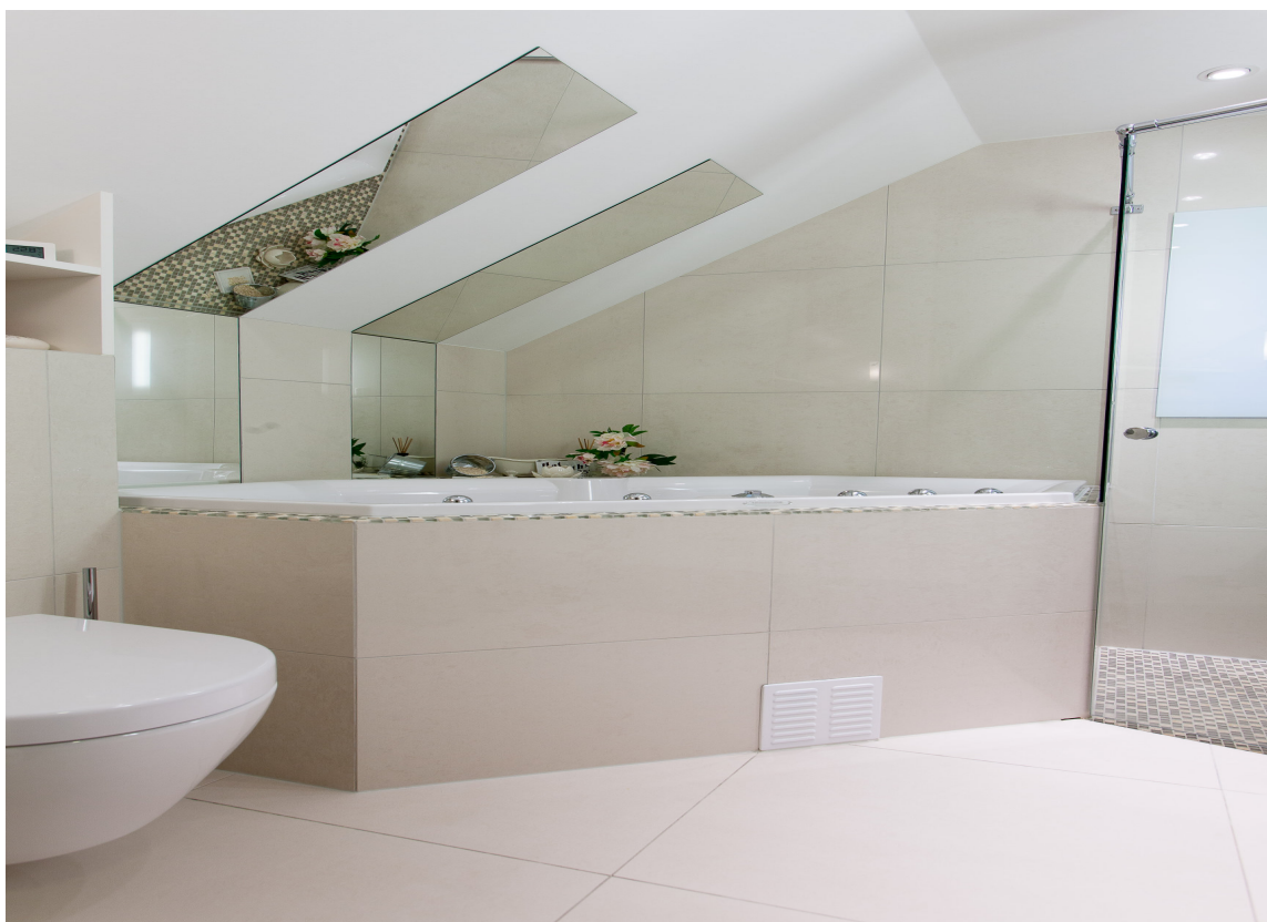
Dekorfliser gir ekstra effekt.