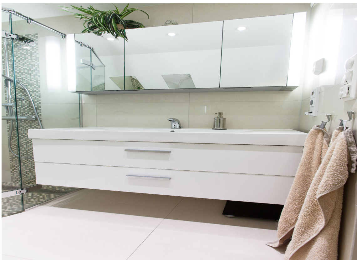
Belysningen har stor betydning.