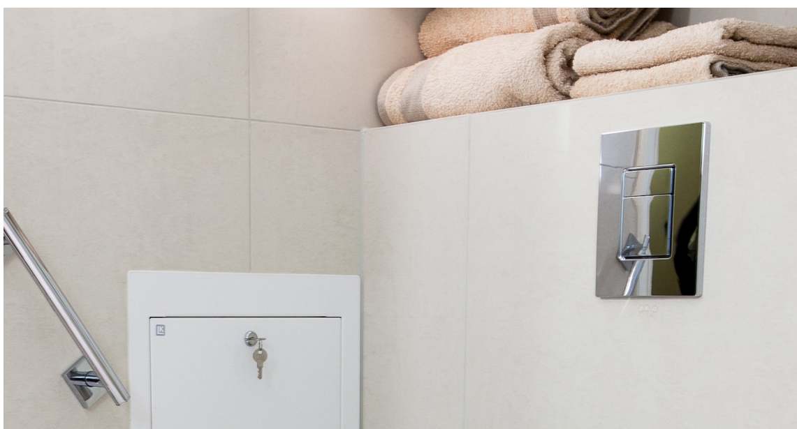
Nisjer kan brukes til oppbevaring.

– I skråtaket over badekaret er det plassert speil for å øke romsligheten i rommet. Vinduet i dekket vi over med en frostet glassplate med åpningsmulighet. Det gjør at karmen ikke skades av vannsprut, og at man kan åpne det for bedre utlufting. Jeg ser ikke på et vindu som en hindring, men som en tilgang på dagslys og luftemulighet, sier hun.