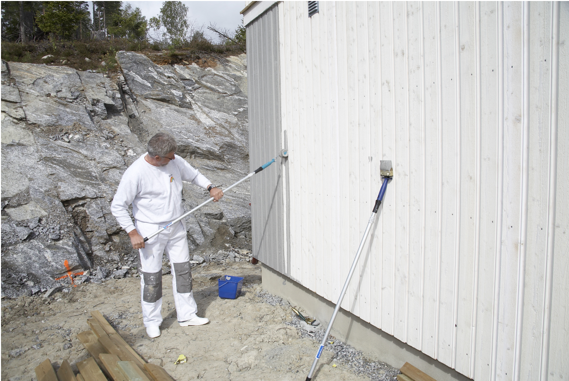
Grunning inneholder råtehindrende midler.