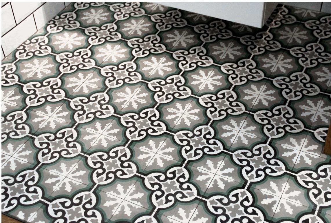
Sementfliser er håndlagde, og krever litt ekstra pleie – men kan likevel vare i hundre år. Her fra Golvabias kolleksjon Palace.

Flisene settes i mørtel eller ved hjelp av spesiellim og -fug som tørker raskt og ikke trekker inn i flisen. For å unngå flekker og forhindre at vannet i limet trekker opp i flisen kan sementflisenes frem- og baksida samt alle kanter primes eller fuktes før montering. Etter montering forsegles overflaten med en sealer eller impregnering, før flisene fuges. Avhengig av slitasjen, påføres ny impregnering 1-2 ganger per år. Dette gjøres for å tette porene i overflaten slik at flisene ikke får flekker.