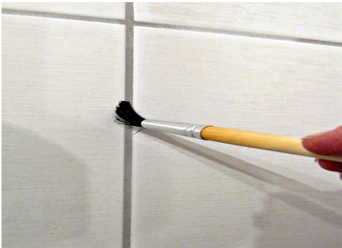
Alanor fugeimpregnering kan påføres med pensel for en mer presis påføring.