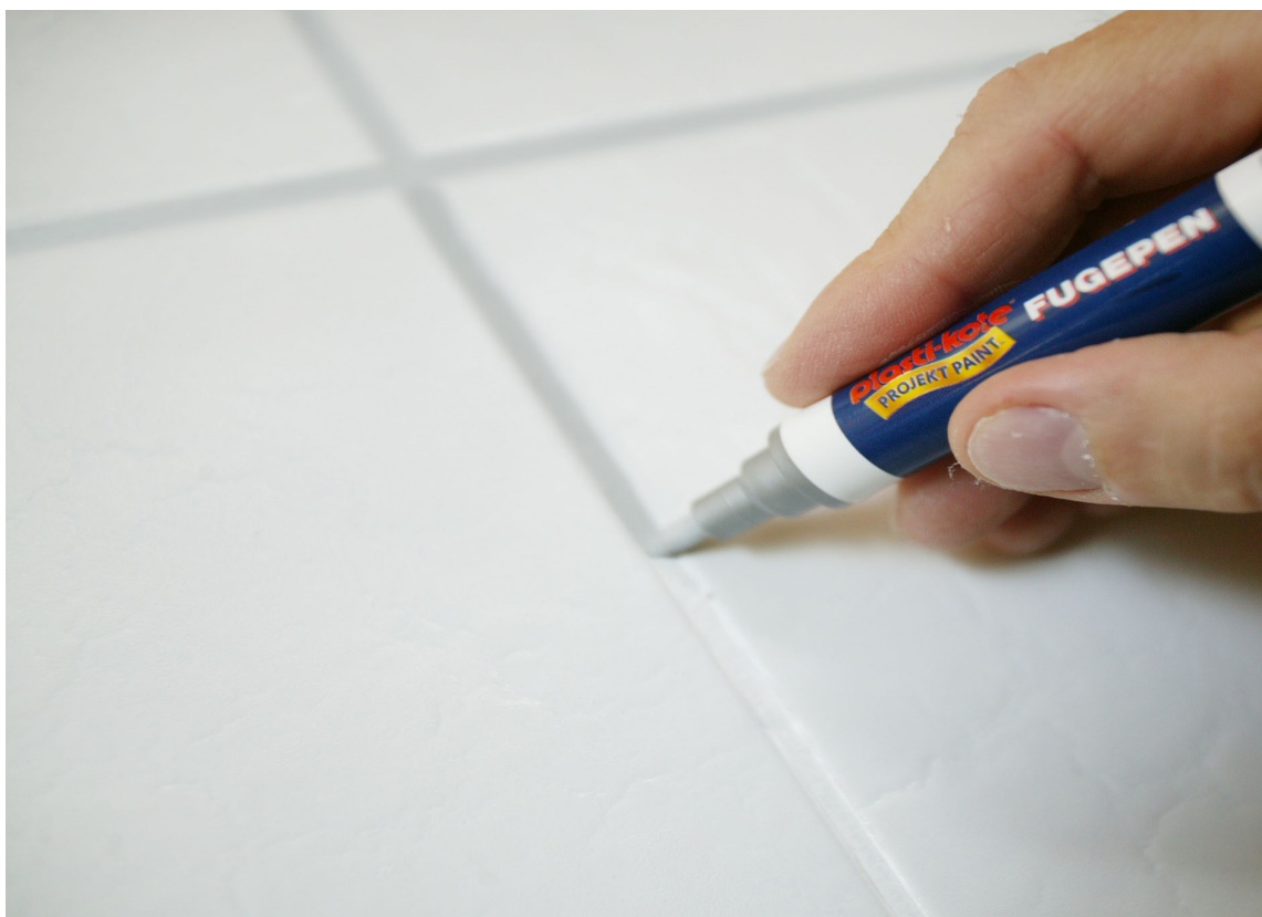
Fugepenn gir straks fugen en ny farge.