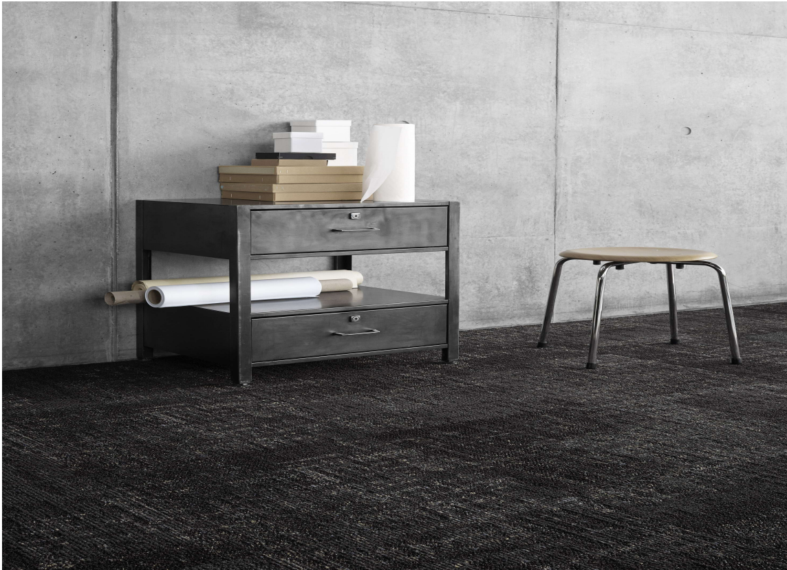
Memory Ecotrust får du i tre ulike mønstre i ni fargevarianter