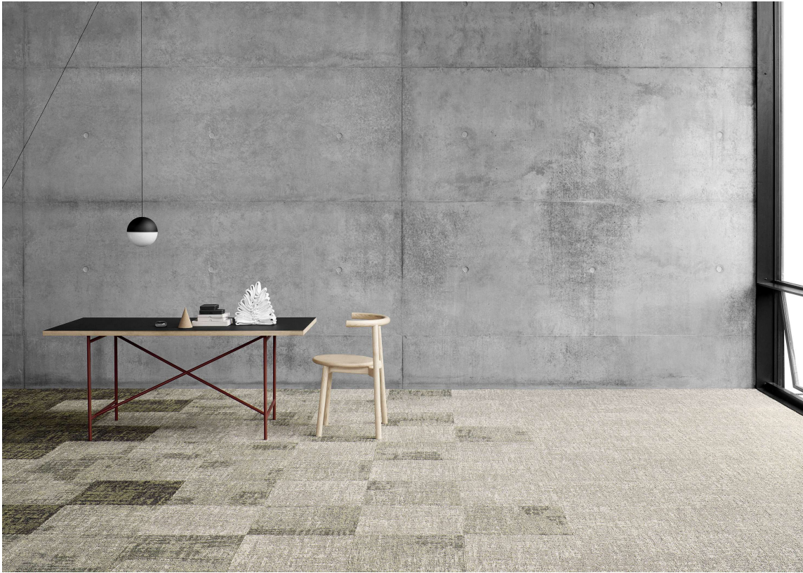
Tepper med rik tekstur er i vinden