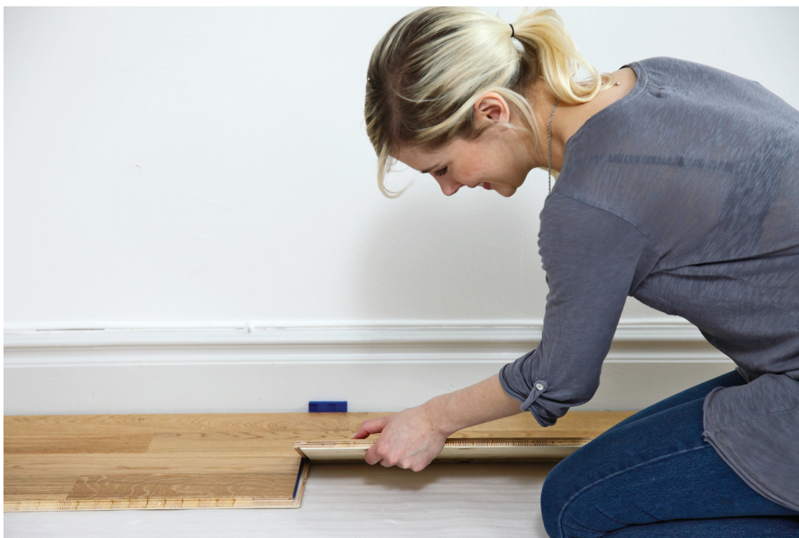
Lag mellomrom mellom gulv og vegg.