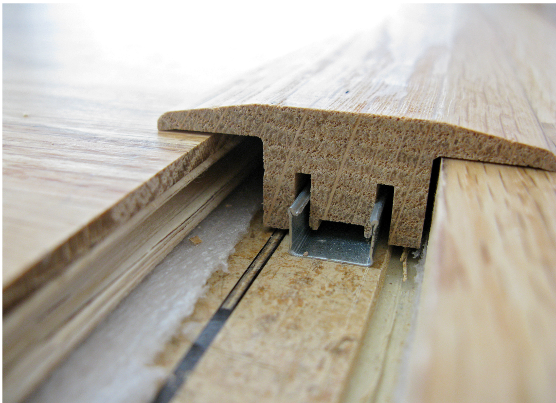
Del opp store flater.