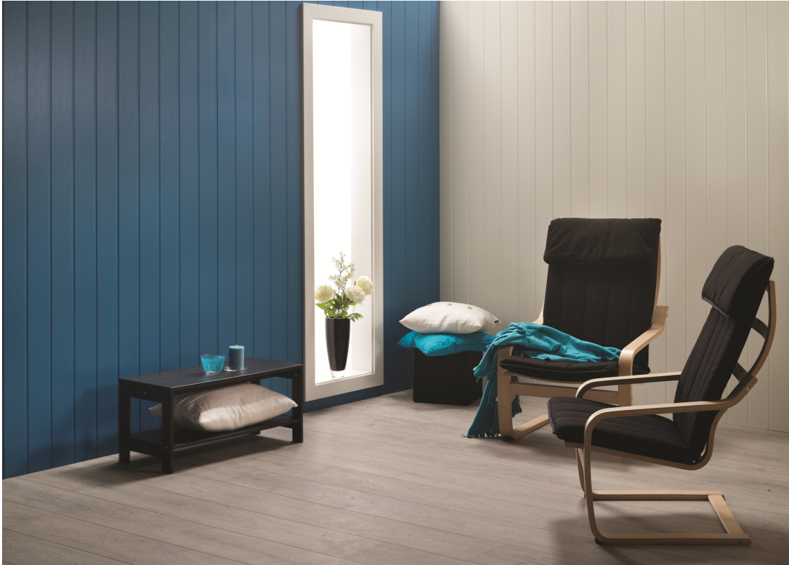
Færre arbeidsmomenter er spart tid og sparte penger, hevder tilhengerne.

Produktutviklingen er massiv, og en lang rekke produsenter følger de vekslende interiørtrendene med argusøyne. Det begynte med plater av MDF, sprøytemalt hvite eller caffè-latte, med freste spor som gir et inntrykk av ekte trepanel, men uten kvister og gulning, og med enkel montering. I dag finnes flere ulike profiler, med og uten penselstrøk, og plater i både klassiske og trendy farger. Og platene lages både av MDF og sponplater, og nå, som siste tilskudd på stammen også i form av krysslimte heltreplater med freste spor.