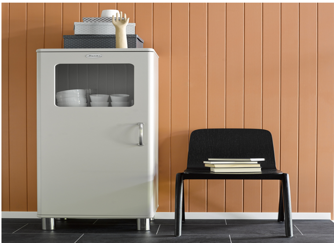
Bredden på alle typer følger standard cc-avstand på stenderverk, 600 mm