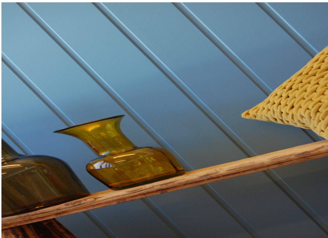
Profil freses ut før platene overflatebehandles.

I MDF- og sponbaserte plater kan lette gjenstander festes med spiker eller skruer direkte i panelet. mens sanitærutstyr, skap, bokhyller og annen innredning alltid må festes i bærekonstruksjonen eller i egne spikerslag bak platene. Heltrepanelet har god bærevne, og kan holde også tyngre gjenstander uten behov for ekstra spikerslag eller montering i stenderverket.