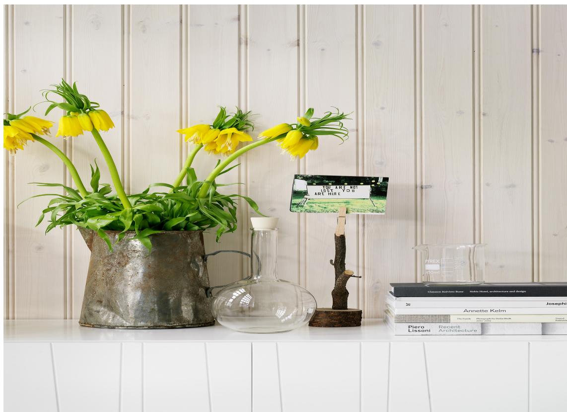
Heltrepanelplater monteres liggende rett på stenderverket.