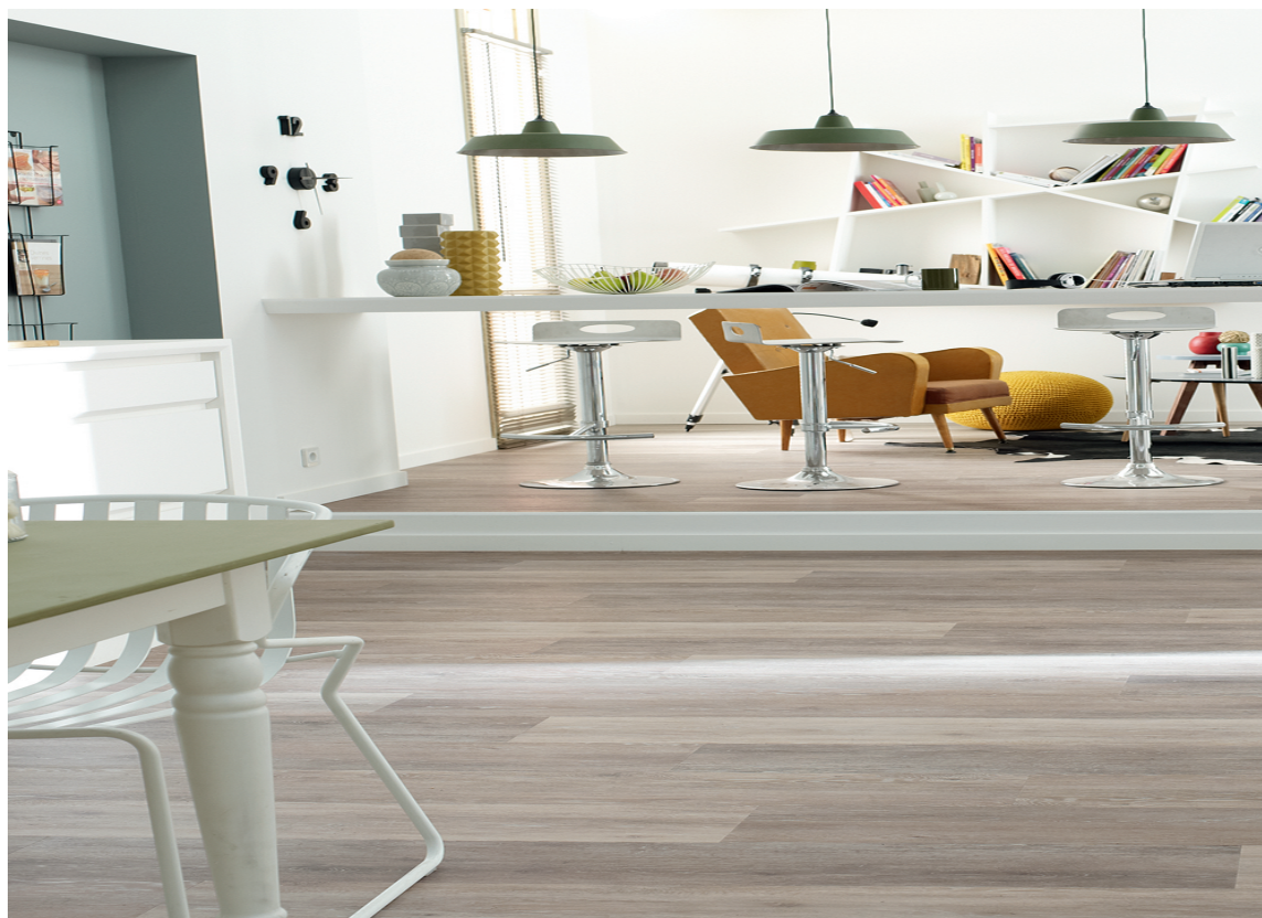
Klikkvinyl fra Starfloor, Tarkett.

Format (cirkamål, avhengig av produkt): tredesign: 20 cm x 100 cm; steindesign: 30 cm x 60 cm