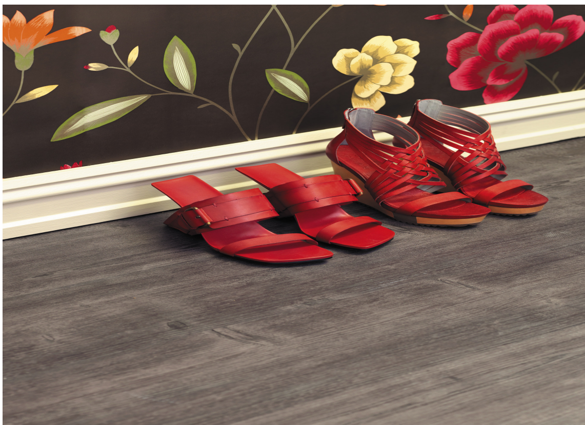
Vinyllaminat med kork fra Storeys.

Format (cirkamål avhengig av produkt): tredesign 20 cm x 120 cm. Steindesign: 30 cm x 90 cm