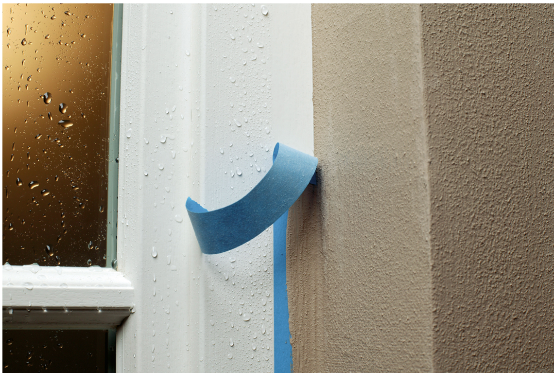
Teip som festes på steder med sterk soleksponering kan lett "brenne" seg fast i underlaget.